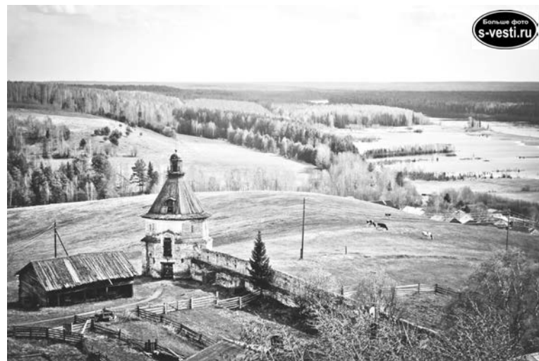
«Северная пастораль», весна 2014г.

По образованию 27-летний фотограф – историк и юрист, но, судя по достижениям на ниве фотоискусства, призвание его все же не в этом. Работы Чудова публиковались в журнале «National Geographic», он дипломант и лауреат региональных, всероссийских и международных конкурсов. В экспозиции из 27 работ, представленной в северноморском выставочном зале, – города, памятники архитектуры, природные красоты стран Европы. Норвежские и швейцарские пейзажи, улицы Хельсинки, соборы Флоренции и Зальцбурга. Попал в объектив фотохудожника и Северо-Запад России. Основной лейтмотив выставки – стирание в современном мире границ, в том числе культурных. Возможность познакомиться с