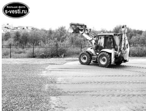
На спортплощадке у школы №8 идет укладка слоя щебня.