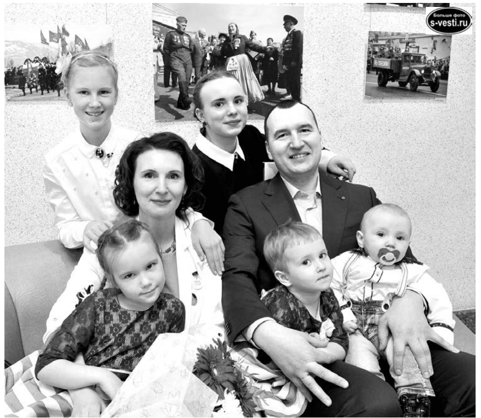
Семья Ефремовых в день вручения почетного знака «Материнская слава» в ДК им. Кирова.

- В этом году я получила сразу три медали. В честь столетия восстановления патриаршества как секретаря архиепископа по связям с общественностью, профессиональную - за оформление музея связи в Управлении связи по ул. Восточной и почетный знак «Материнская