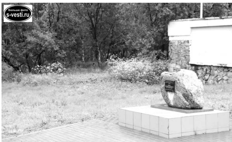
Теперь лужайки в городском парке выглядят более ухоженными и опрятными.

С 1 июля подрядная организация ООО «Инвест ЖКХ» в рамках муниципального контракта по содержанию улично-дорожной сети, а также объектов прочего благоустройства (парков и скверов) приступила к покосу травы. Первым делом подрядчик очистил от нее городской парк. Кроме того, растительность будет убрана и с территорий, относящихся к улично-дорожной сети — трапов. С графиком производства работ североморцы смогут ознакомиться на сайте ад-