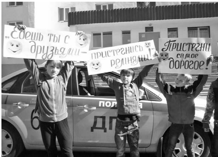
Акция «Пристегнись и улыбнись!».