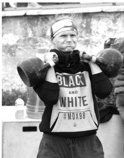
Особо впечатлил зрителей кроссфит.