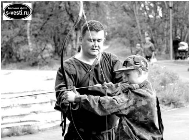
Лучный турнир - одно из развлечений на интерактивной площадке Средневековья.