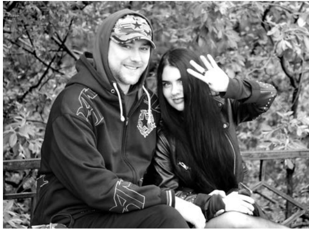
Для любителей рок-музыки в минувшее воскресенье в городском парке выступили коллективы «Частица N», «Аменция» (Оленегорск) и сборная команда музыкантов Мурманской области.