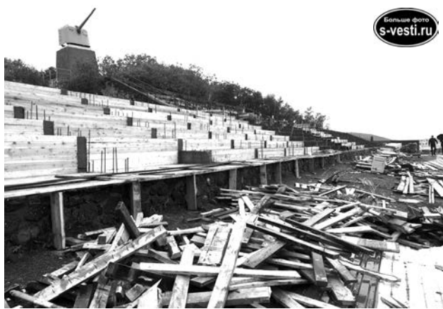
День ВМФ североморцы встретят на обновленной трибуне.

Работы ведутся в сухую погоду, включая выходные. В настоящий момент строители уже закончили заливку основания конструкции бетоном, а со следующей недели планируют собрать настил. Все необходимые материалы и оборудование, включая новые сидения, у строителей в наличии. В данный момент работы идут в соответствии с графиком. Срок сдачи готового объекта - 16 июля, подрядчик прилагает все усилия, чтобы успеть, хотя многое