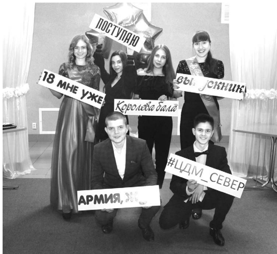
В фотозоне «Выпускник-2018» все желающие могли запечатлеть себя с одноклассниками.