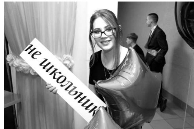
Организаторы позаботились об атрибутах для ярких снимков в фотозоне.

Мне стало известно, что обычно на городской выпускной администрация приглашает вокалистов. Диджеи на таком значимом событии – своего рода эксперимент. Но такую музыку как раз и слушают старшеклассники и студенты, это наша аудитория. День первокурсника, выпускной – наши любимые мероприятия. Публика всегда живо реагирует, подхватывает хиты, веселится. Завтра летим с коллегой в Нижневартовск на День молодежи. Там будет дискотека под открытым небом. Летом обожаю выступать на природе. Если бы не переменчивая северная погода, могли бы и сегодня устроить open air!