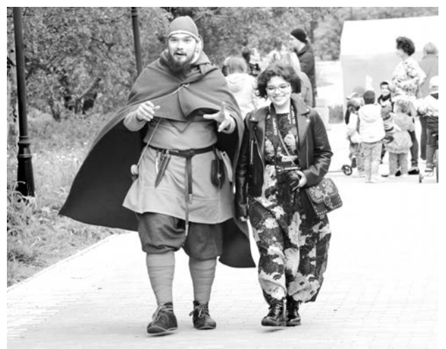
На аллею парка - прямо из Средневековья.

22 июня в 04.00 на североморском военно-мемориальном кладбище прошла 10-я Международная мемориальная акция «Свеча памяти».