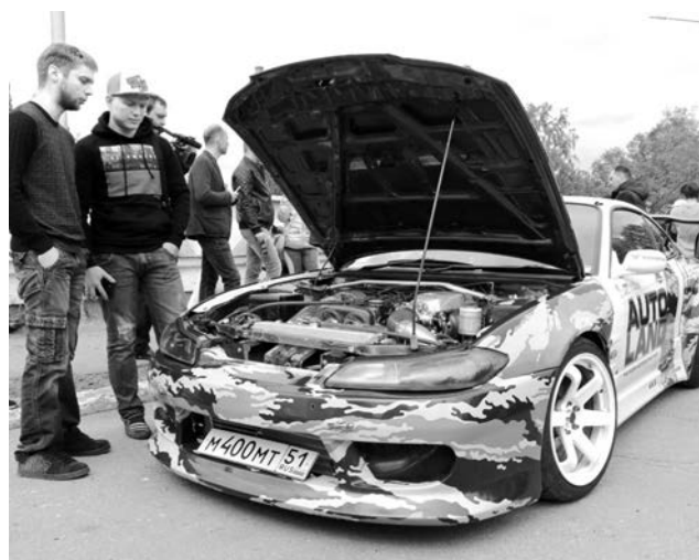
Тюнингованные авто и мототехника привлекли внимание североморцев всех возрастов.