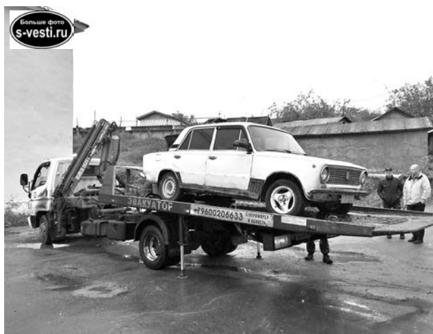
Эвакуация автохлама идет с 2014 года.

- Собственнику направляется извещение, с момента получения которого в течение 3-х суток он должен убрать транспортное