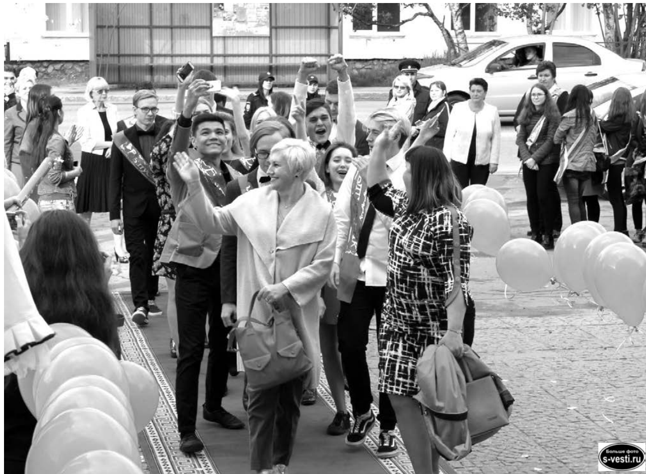
На праздник в ЦДМ выпускники и наставники шли по красной ковровой дорожке.