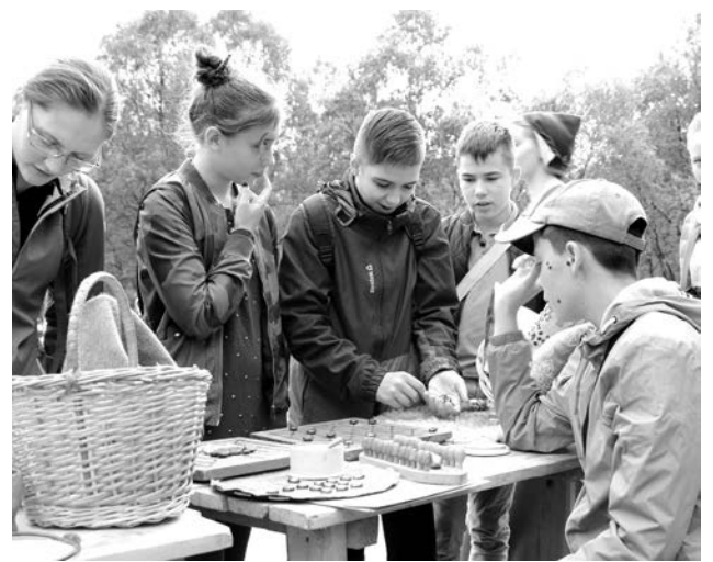
Настольные игры времен Робин Гуда.