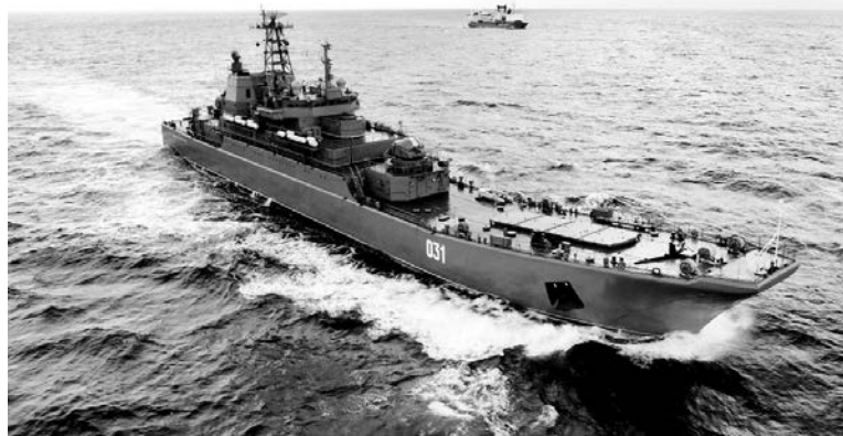
БДК «Александр Отраковский».

Североморцы отрабатывают полный спектр оборонительных действий сил и войск в зоне ответственности Северного флота: