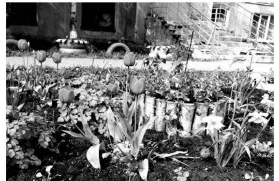
Нарядная клумба на ул. Сивко, 1а.