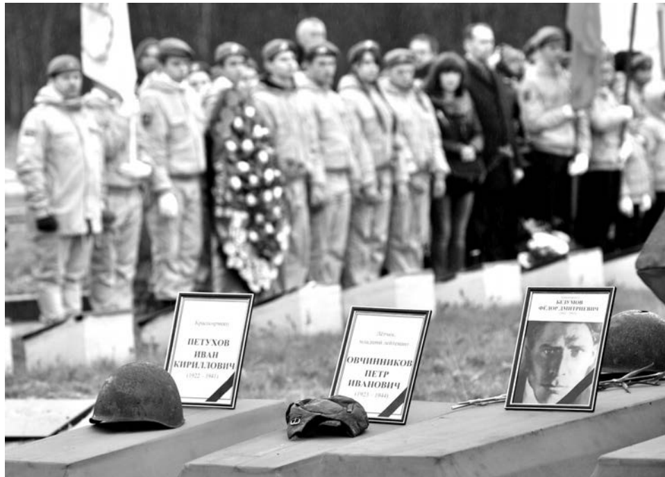
Североморская делегация, в которую входят и поисковики, ежегодно принимает участие в торжественном захоронении бойцов в Долине Славы.