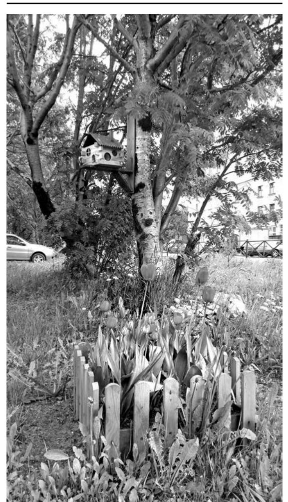
Милый уголок и на ул. Комсомольской, 1.