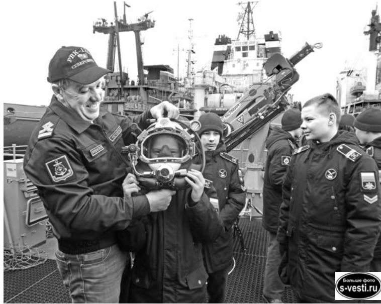
От желающих примерить водолазное снаряжение отбоя не было.

Ребята побывали на стрельбище под Мурманском и смогли пострелять по мишеням из автомата Калашникова. В отдельной Краснознаменной Киркенесской бригаде морской пехоты Северного флота мальчишки узнали об элитной службе «черных беретов» и даже представили себя на их месте во время практических занятий по огневой и тактической подготовке, и особенно, когда проходили полосу препятствий. В Полярном нахимовец подумал о специфике подводного флота и провел экскурсию на подводной лодке. В Североморске-3 мальчишкам показали знаменитые