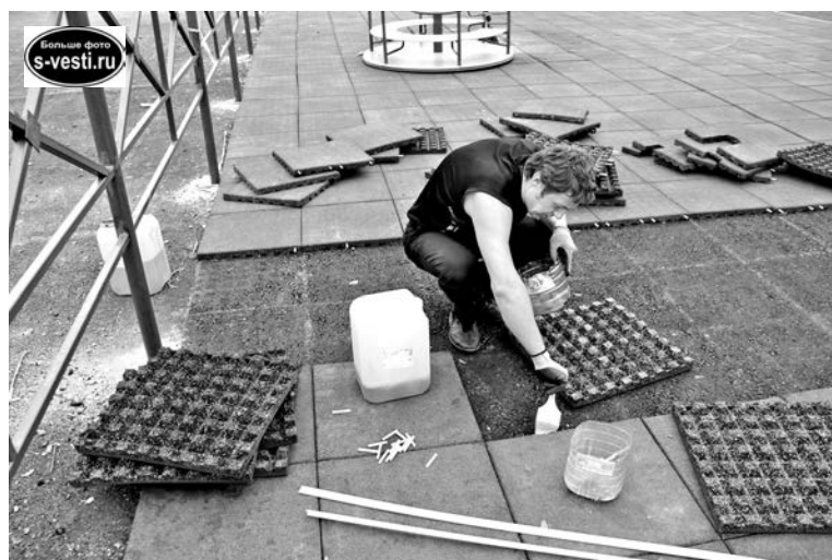
Суперклей, взаимное сцепление, видеонаблюдение - тройная антивандальная защита.

Последней точкой рейда стала площадка для детей и массовых гуляний в п.Сафонове, которая должна была быть введена в эксплуатацию в рамках «Формирования комфортной городской среды» в прошлом году, но по объективным причинам (в частности, из-за украденной резиновой плитки) этого не произошло. Сейчас по периметру площадки установлены камеры видеонаблюдения. Подрядчик - компания «МегаСнаб Север» - приобрела специальный клей для склеивания плиток между собой и их спайки с покрытием. Для их сцепления, кроме