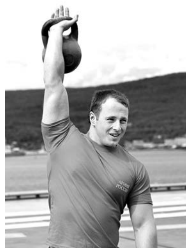
На Северном флоте традиционно популярен гиревой спорт.

Сбор открыл в понедельник в ДК «Строитель» начальник Уп-