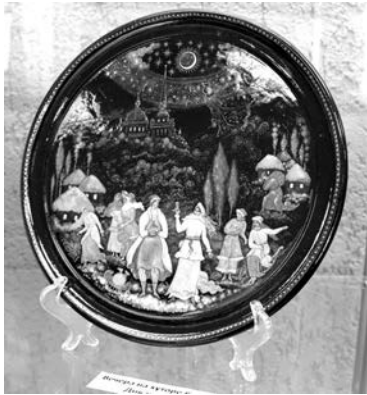
«Вечера на хуторе близ Диканьки», палехская роспись.