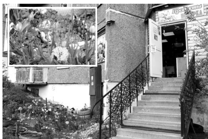
Хозяйки магазина на ул. Полярной, 6, – большие любительницы тюльпанов.