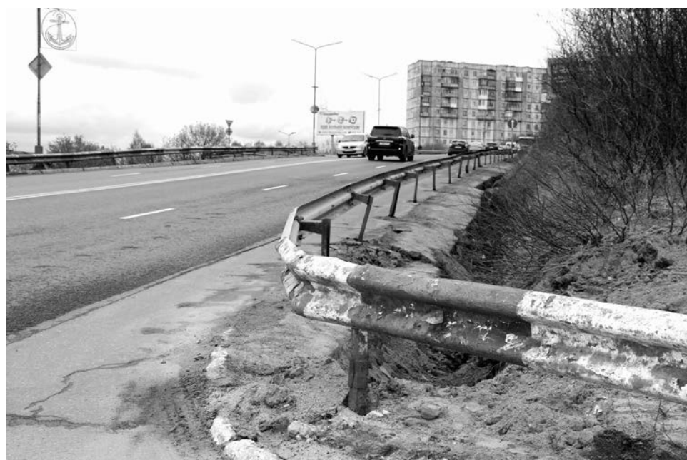
Обшарпанный дорожный отбойник по пути на ул. Северная Застава вскоре заменят новым.