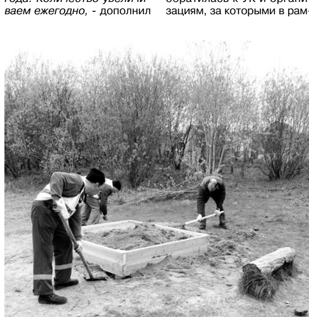
Песочницы во дворе дома №9 по ул. Чабаненко раньше не было.