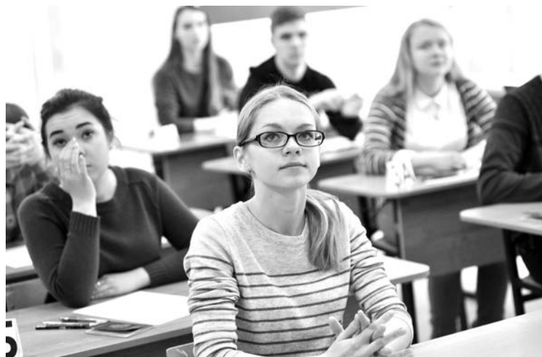
Экзамен - дело, конечно, волнительное, но ребята усердно готовились.