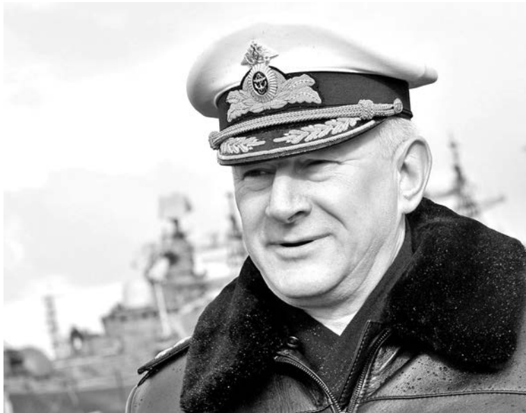
Командующий СФ адмирал Николай Евменов.

Хочу сказать, что с точки зрения современного оснащения Северный флот идет не только в ногу со временем, но по отдельным показателям и опережая его. В интересах обеспечения безопасности России в Ар-