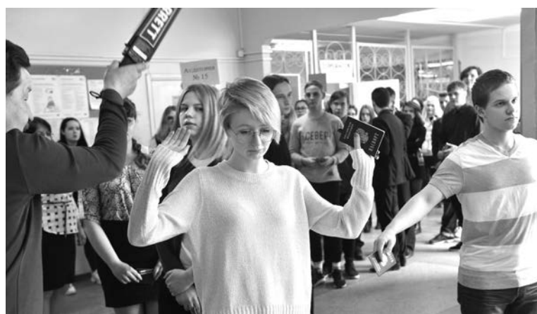
Все участники ЕГЭ прошли стандартную проверку металлоискателем.