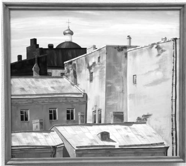
«Лестница в небо» (оргалит, темпера).