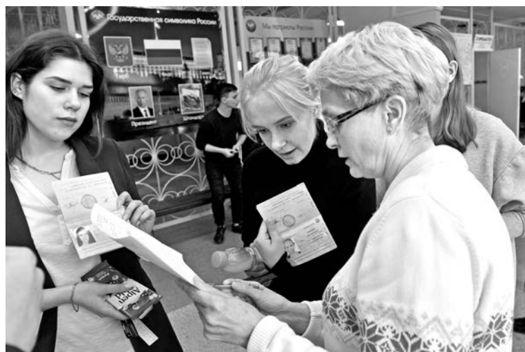
Паспорт обязательно должен быть при себе.