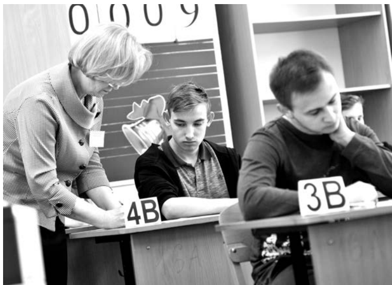
В аудиториях выпускникам еще раз напомнили правила поведения на экзамене.