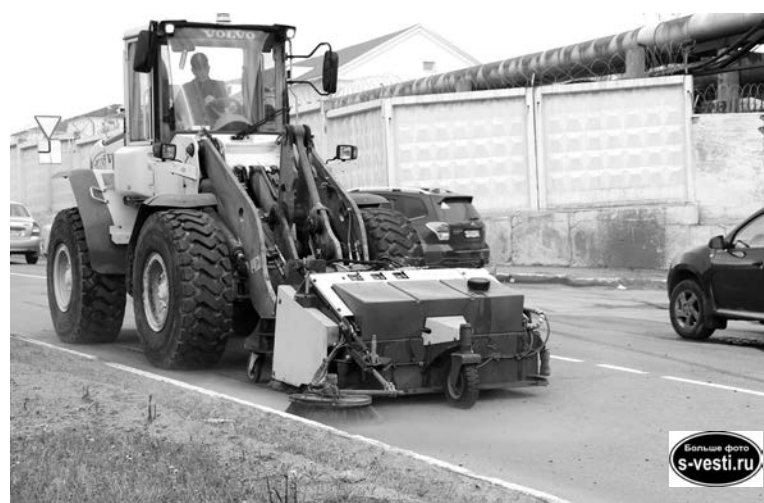
Уборка дорог от песка, оставшегося после зимы, - одно из приоритетных направлений в работе подрядчика.