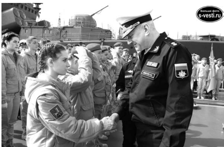
С первых дней создания в Заполярье юнармейских отрядов командующий Северным флотом Николай Евменов поддерживает новое молодежное движение.

Новое движение по своим целям и задачам очень близко к пионерской организации, хорошо знакомой людям среднего и старшего поколения. Теперь же военное ведомство вместе с учреждениями образования, ДОСААФ и ЦСКА решили соединить накопленный опыт военно-патриотического воспитания детей и подростков и вло-