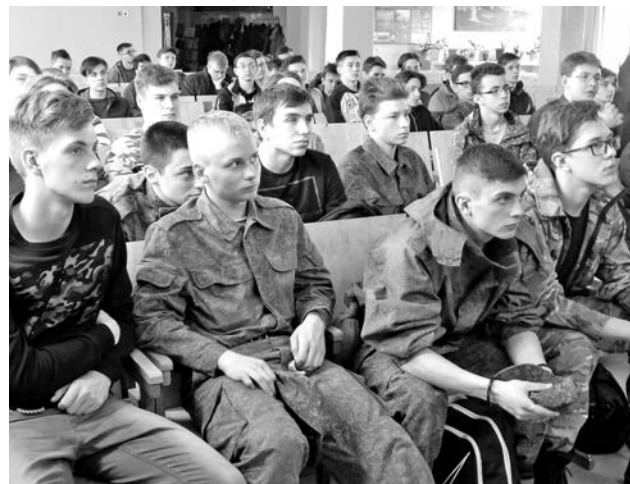
Парней, решивших поступать в военные вузы, легко было узнать по заинтересованным лицам и камуфляжной форме.

В этом году в течение пяти дней школьники занимались по программе