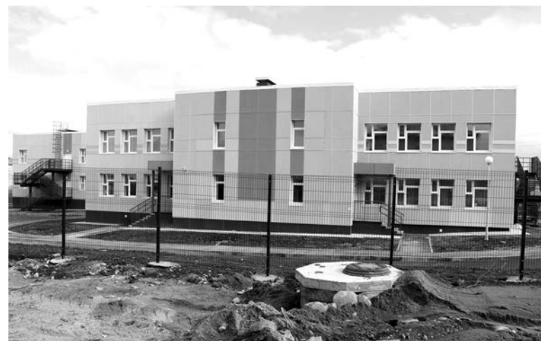
Неблагоустроенная территория вокруг нового детского сада портит впечатление от всей проделанной работы.

и новым детским садом. Объект сдавался зимой, после того как растаял снег, стали видны некоторые недочеты и недоработки: оставшийся после строительства садика мусор и просевший грунт. Их устранением занимается подрядчик ООО «Мурманск строй». Работы начались 15 мая, а завершиться должны до 10 июня.