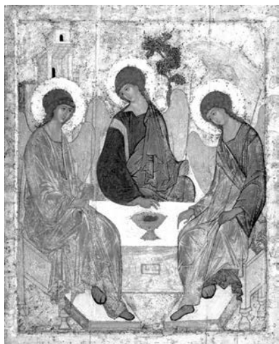
Рублев, икона «Троица».

Свидетельством Его присутствия станет Дух Святой: «Не уходите из Иерусалима, пока не получите дар Духа Святого, который будет свидетельствовать обо мне и напомнит все, что я вам говорил». Вскоре, на 50-й день по воскресении, в иудейскую Пятидесятницу, когда апостолы вместе молились, вдруг случился