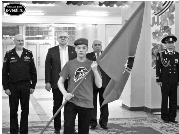
Знамя дружины будет сопровождать юнармейцев на всех значимых мероприятиях.