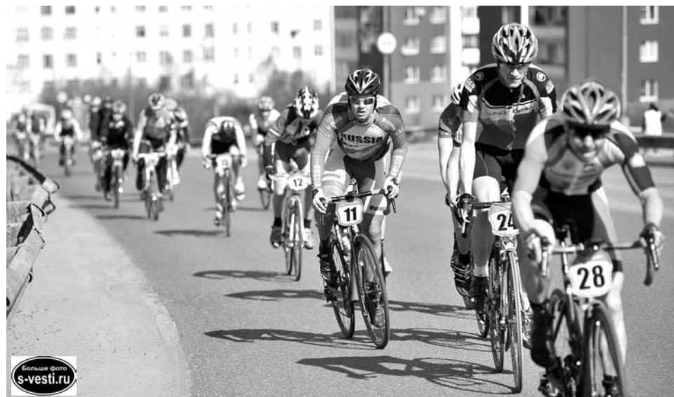
«Гонка в гору» - одно из самых ожидаемых соревнований среди велосипедистов Заполярья.