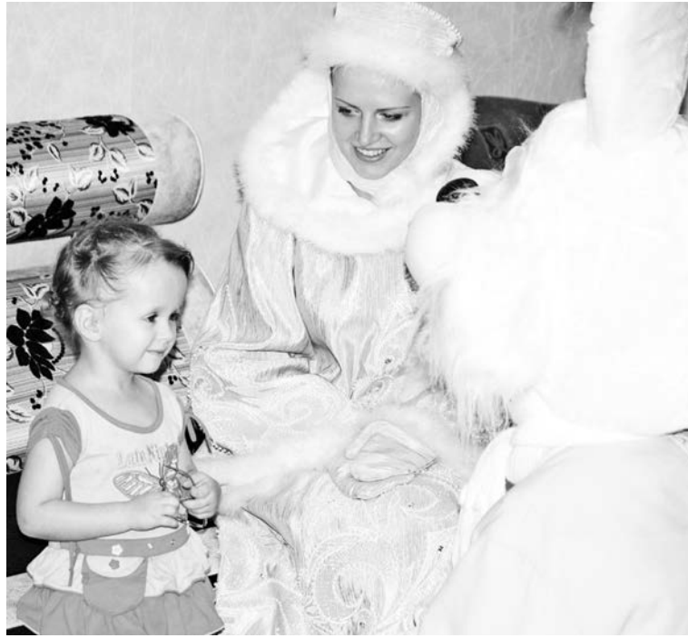
Доставка хорошего настроения на дом для сказочных героев – дело привычное и приятное.

Анна ВИХРОВА.