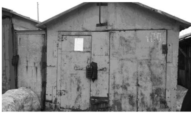
Фото самовольно установленного объекта