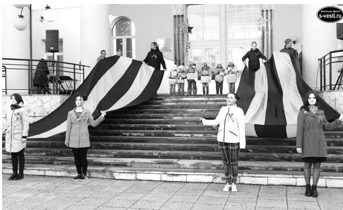
Ежегодно для акции «Георгиевская ленточка» приобретается несколько тысяч этого символа Победы.