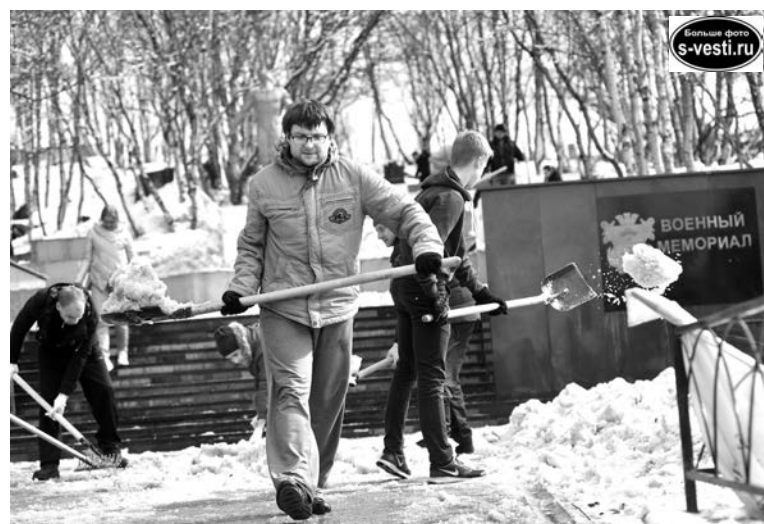
На воскресную уборку вышло столько людей, что инвентаря хватило не всем - работали по очереди.

Чистым, как палуба корабля, Североморск пока не стал. Фронт работы большой: детские площадки, дворы, участки коммерческих объектов. Не обращали внимания? Посмотрите небольшой фоторепортаж «с полей».