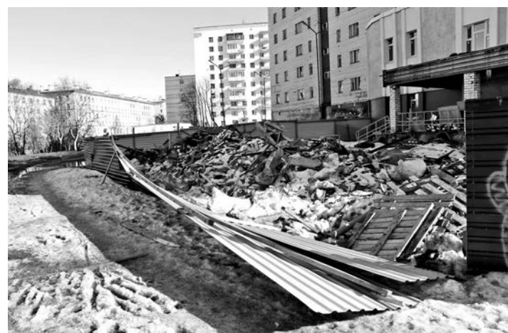
Поликлиника в ремонте и мусоре (ул.Душенова, 8а).