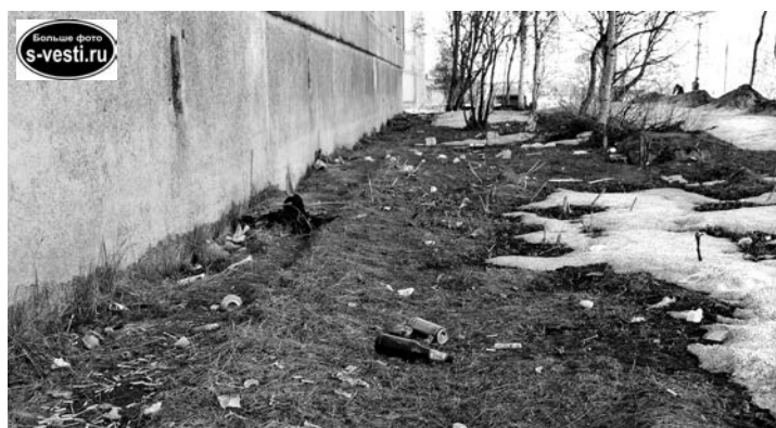
За дом по ул.Душенова, 8/9, страшно заглядывать.