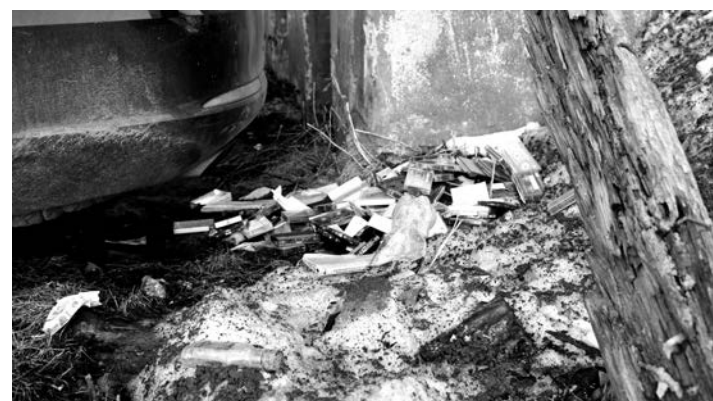
Ломоносова, 13: до баков не донесли аудиокассеты.