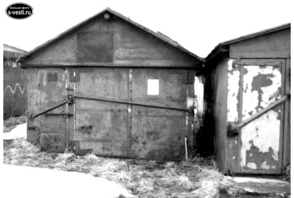
Сотрудники КИО уведомили каждого владельца гаража по ул.Пионерской о необходимости освободить неправомерно занимаемый земельный участок. Фотоотчет КИО на стр. 35-47.