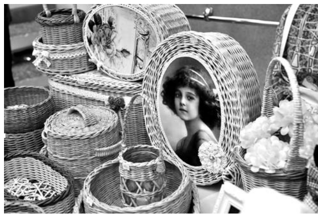
Такою бы шкатулку под женские украшения!