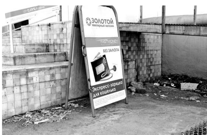
Не все то золото... (ул.Ломоносова, 3).