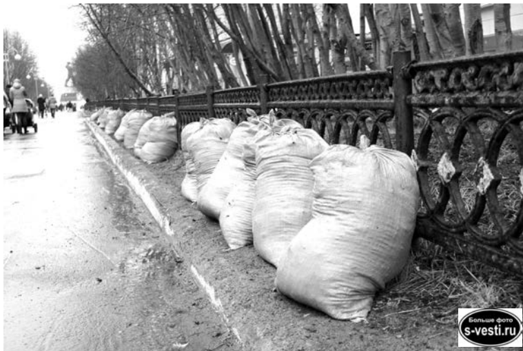
Шеренга мешков с мусором по ул.Сафонова.