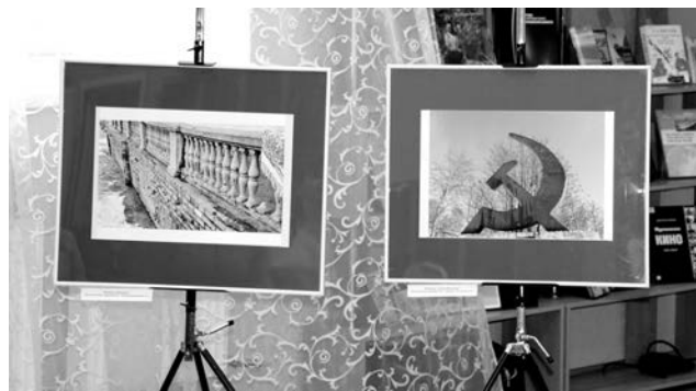
На фото: работы команд «Винтаж» и «Семья Функнер».

Поставить самовар на голову, развесить чайные чашечки на рябине, залезть на дерево, обойти полгорода, заплести в сугроб – и все это ради удачного кадра.