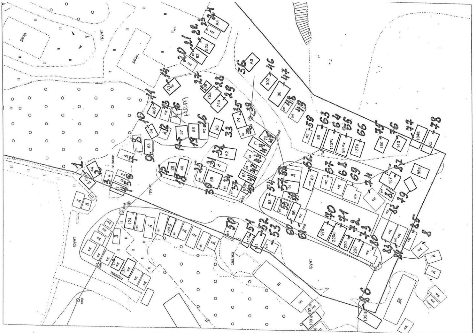
Схема размещения самовольно установленных объектов по адресу: Мурманская обл., г. Североморск, ул. Пионерская (земельный участок с кадастровым номером 51:06:0030106:1589)

Комитет имущественных отношений администрации ЗАТО г.Североморск сообщает о необходимости владельцев объектов, расположенных на вышеуказанном земельном участке, срочно обратиться в Комитет по адресу: 184604, Мурманская обл., г.Североморск, ул.Сафонова, д.18 каб.3, каб.4, контактный телефон: (81537)48240, (81537)47986.