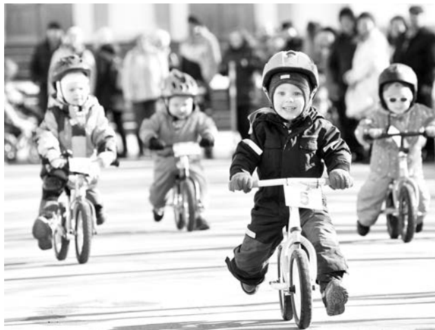
Возле ДОФа прошло соревнование среди малышей на беговелах.