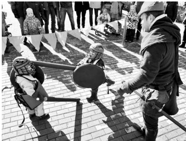
Реконструкторы из клуба «Фьорд» учили управляться со спортивным мячом.