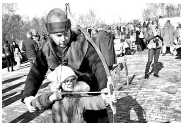
Благодаря любителям исторической реконструкции можно было и потренироваться в стрельбе из лука.