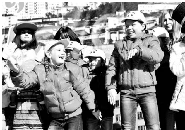
С днем рождения город поздравили участники детского проекта «Сцена для всех»: воспитанники детских садов, школ и спортивно-оздоровительного центра - а также коллективы ЦДМ, ДК «Строитель», ДДТ им.Саши Ковалева, Ловозерского ЦРДК.