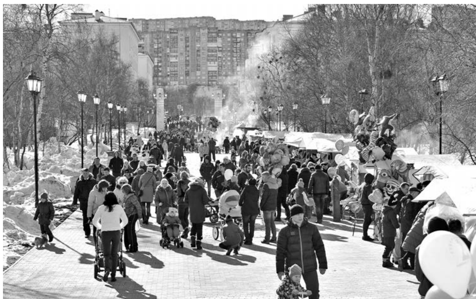
Палатки с разнообразными товарами, шашлыки, выпечка и все, что нужно для праздника. Торговая ярмарка в этот раз удачно расположилась на главной аллее городского парка.