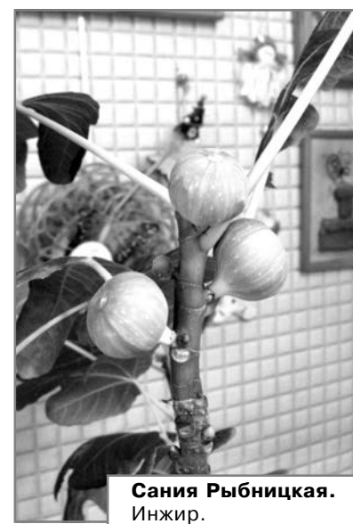
Сания Рыбницкая. Инжир.