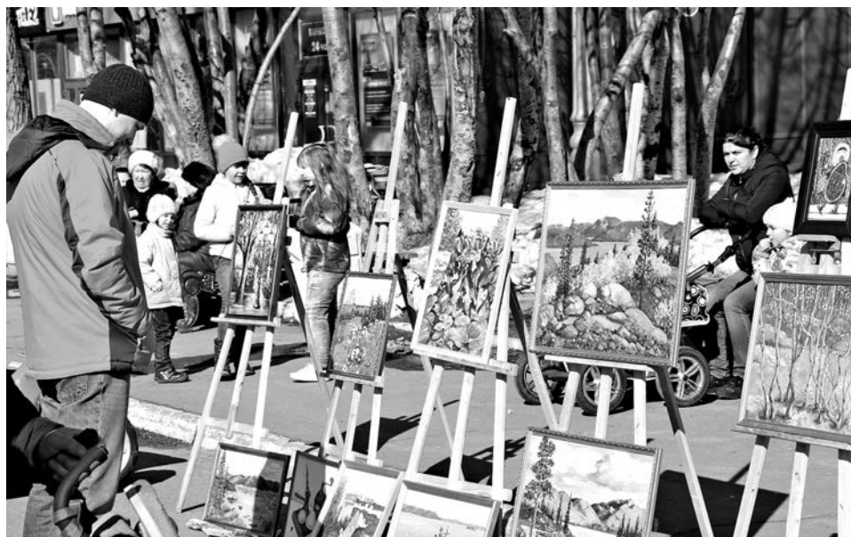
На улице Сафонова зрителей ждал «Североморский Арбат». Выставка под открытым небом объединила картины художников и рисунки воспитанников Детской художественной школы.