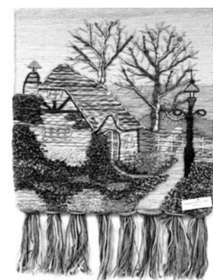
Гобелен, из фондов СМВК.

– Больше всего понравился декупаж. Там мы и грунтовали, и клеили, и рисовали. А самым сложным оказался холодный батик, пото-