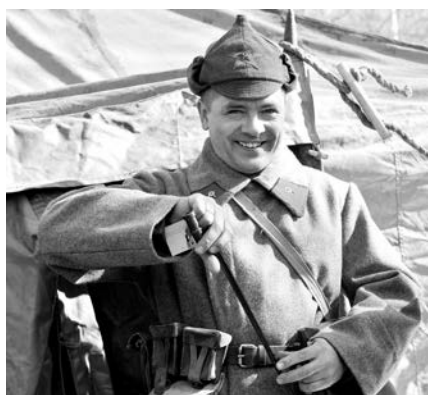
Возле палатки с армейским вооружением и обмундированием дежурил красноармеец.