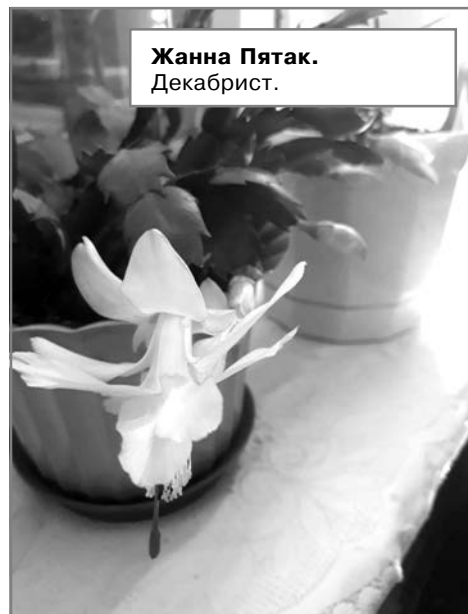
Жанна Пятак. Декабрист.