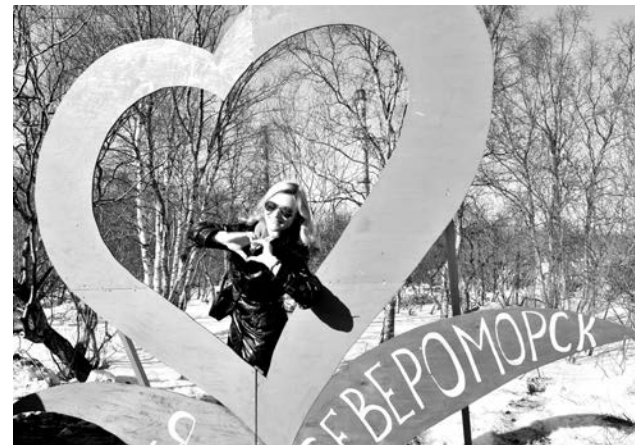
Фотозона в городском парке.