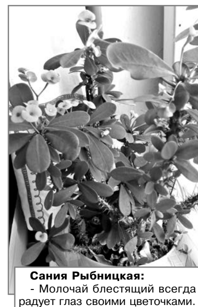
Сания Рыбницкая: - Молочай блестящий всегда радует глаз своими цветочками.