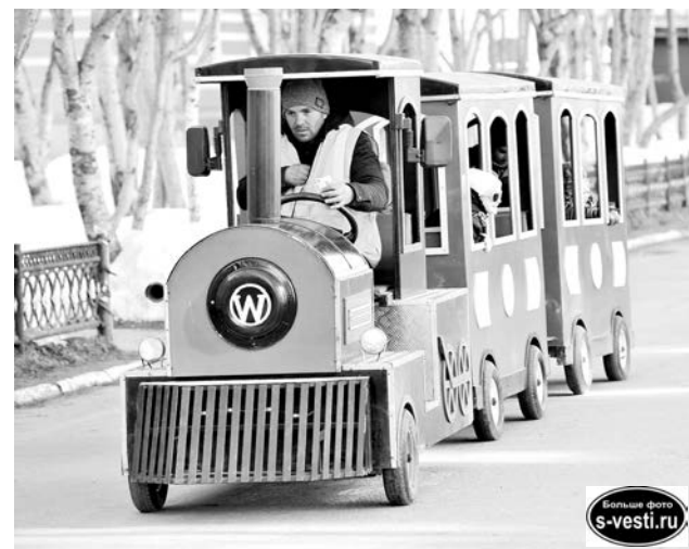
Паровозик, карусели, машинки, батуты и надувные горки - у детворы было множество возможностей отлично провести время.