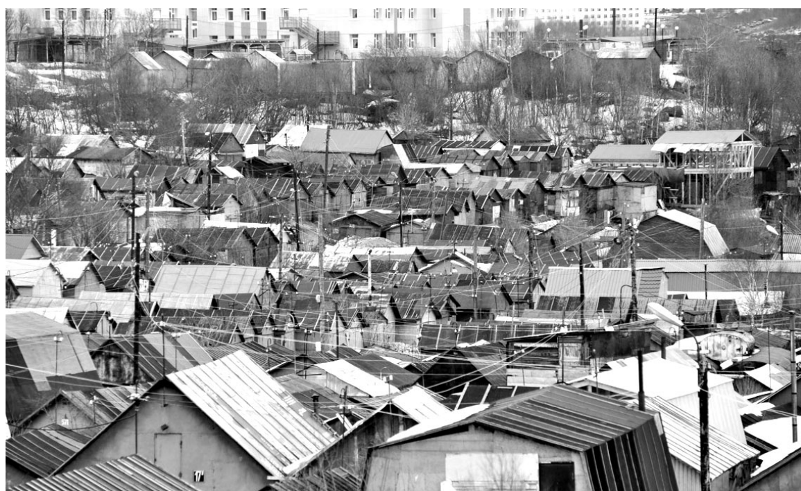
На ул.Кирова: городок в городке.

Наталья СТОЛЯРОВА.