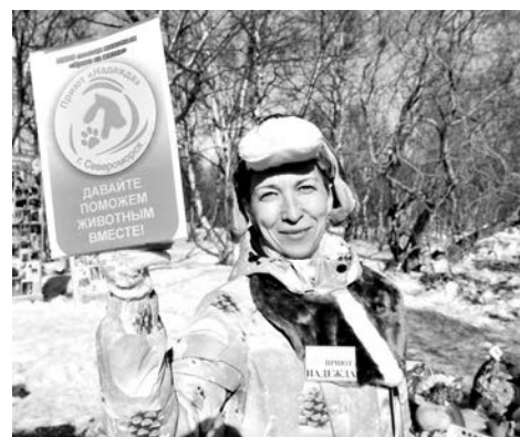
В парке развернулись благотворительные акции и сборы, в том числе - для приюта «Надежда».