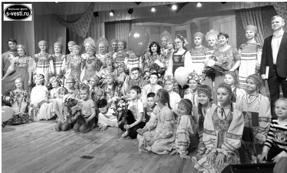
Для всех участников «Родничок» стал семьей, и в воскресенье на юбилейном концерте она наконец собралась в полном составе.

При поддержке Управления образования ЗАТО Североморск и администрации ДДТ за два года «Родничок» побывал в Ульяновске, Суздале, Нижнем Новгороде. Очень много всероссийских и международных конкурсов в последнее время проводится в Мурманске. И «Родничок» их старается не пропускать. В этом учебном году старшая и младшая группы коллектива стали лауреатами первой и второй степеней на конкурсе «Новая волна», а средняя – финалистом той