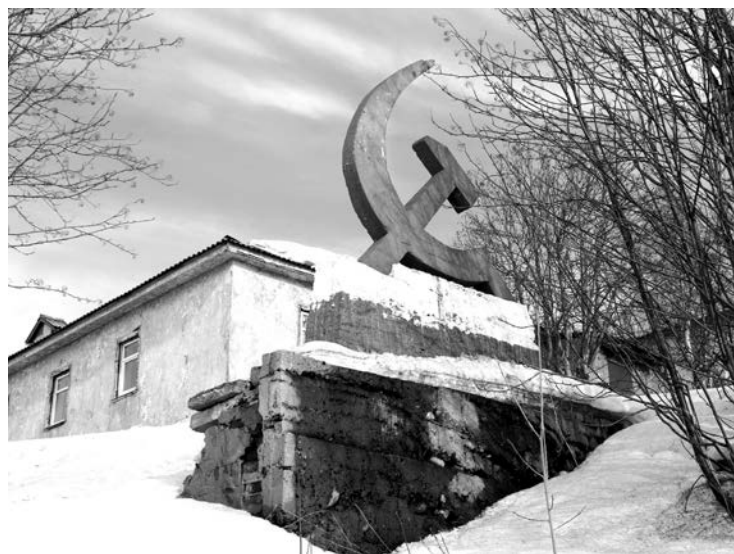
«Специалисты»: «Коси и забивай! А про Родину не забывай...»

Все фотоотчеты участников можно посмотреть на сайте «СВ» в разделе «Конкурсы»: http://www.s-vesti.ru/actions/73-fotokvest-moy-severomorsk/ .