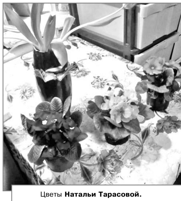
Цветы Нatalьи Тарасовой.