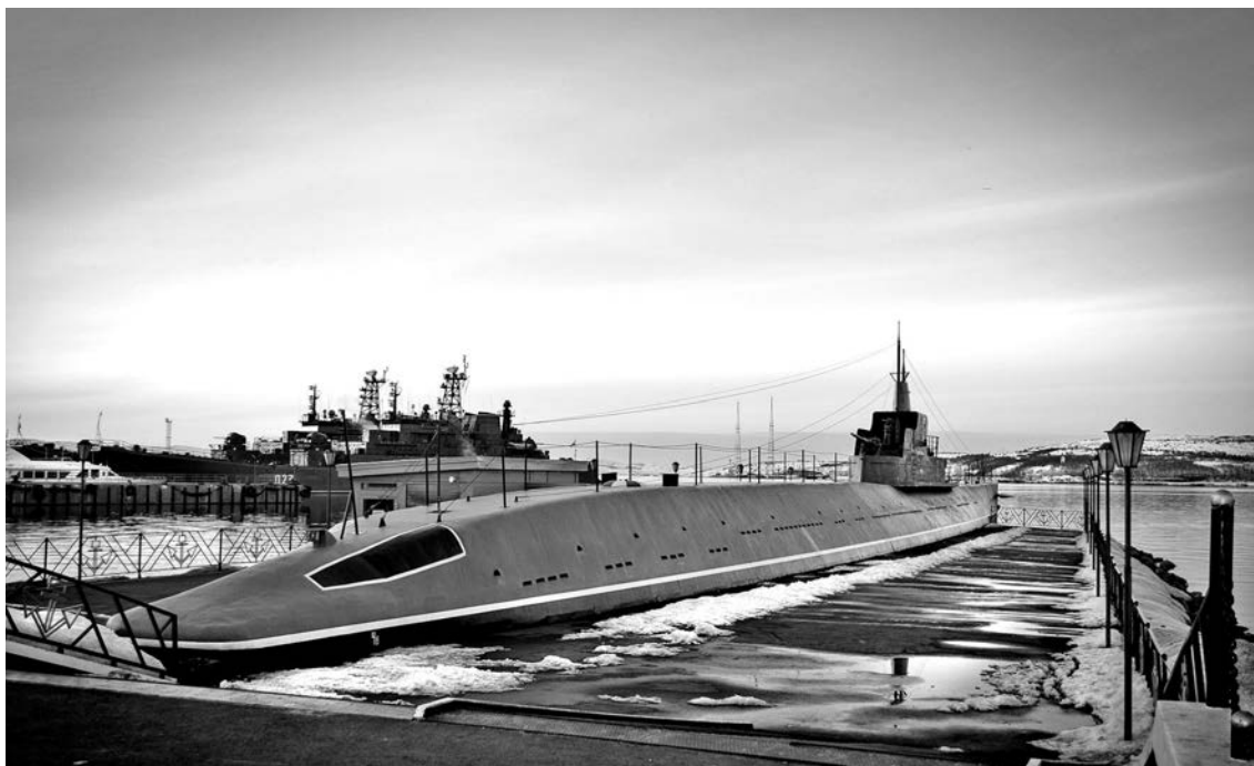
Школа №1: «Катюша».

Благодарю редакцию «СВ» за шикарные выходные, положительные эмоции и новые знания о нашем городе! Девчонки-коллеги по команде! Вы лучшие! Отдельное спасибо нашему бессменному водителю!