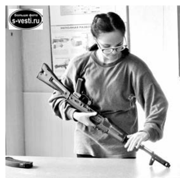
Дебютная сборка/разборка автомата АК-74.

В состязаниях участвовали команды школ, каждая из которых состояла из 5-7 человек, мальчиков и девочек. В младшей возрастной группе (4-6 кл.) было 6 команд, в старшей (7-11 кл.) - 5. У тех и у других было по 4 вида заданий. У