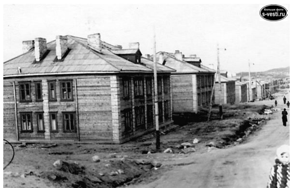
Деревянные дома составляли основу жилфонда молодого города.

Остальной жилфонд составляли деревянные сборно-щитовые дома. К примеру, будущая улица Сгибнева была построена на болотистой местности. Старые деревянные дома стояли на сваях, а