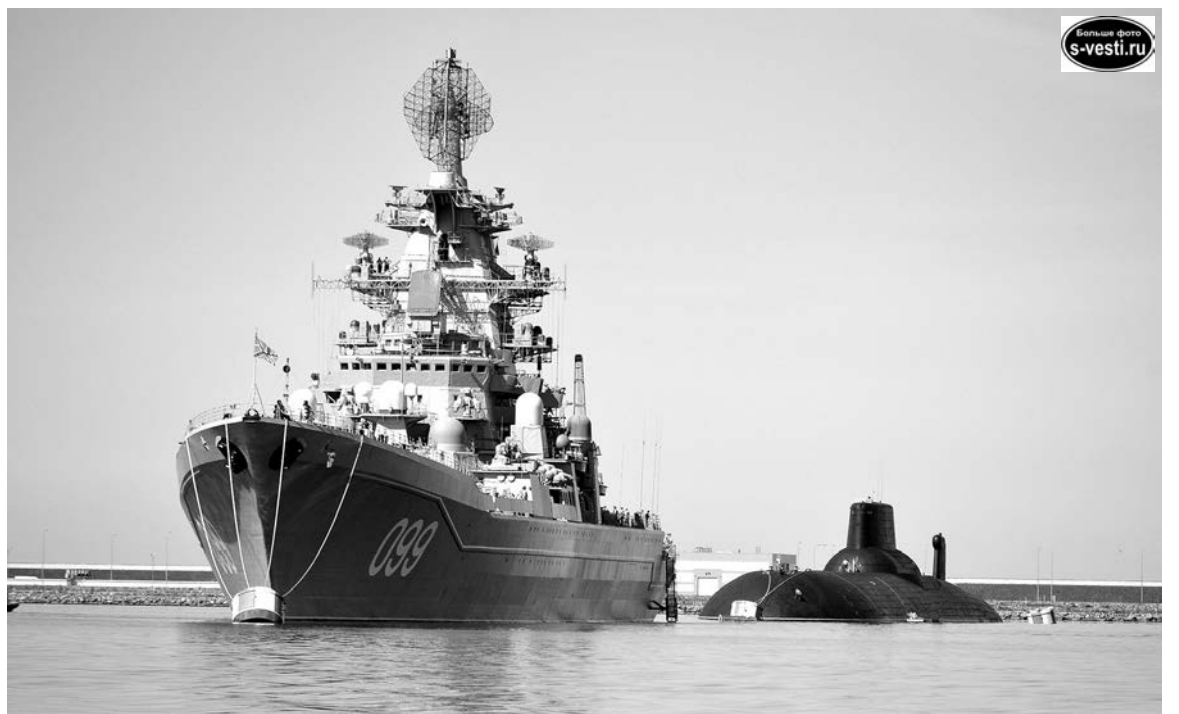
ТАРКР «Петр Великий» участник парада в честь Дня военно-морского флота на Кронштадтском рейде.

Ольга ВОРОБЬЕВА.