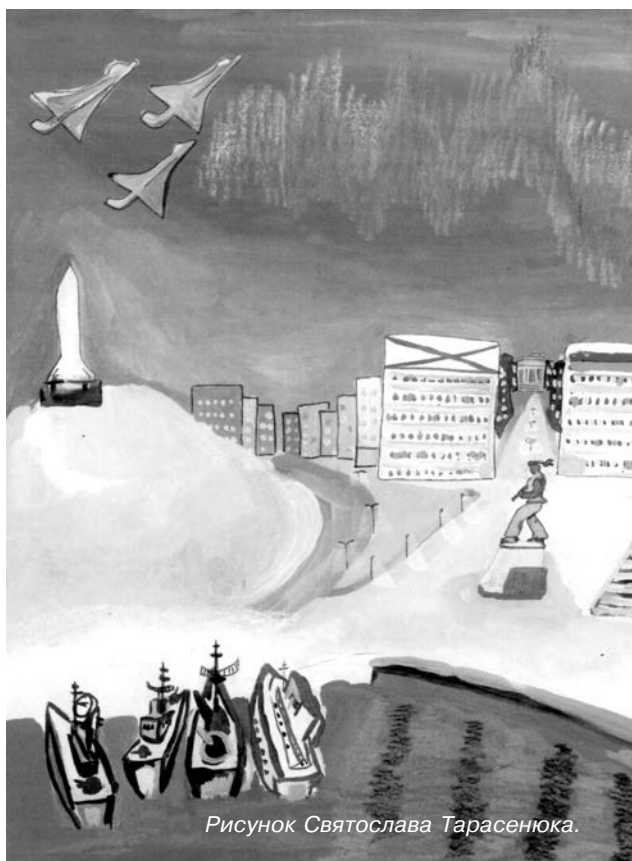
Рисунок Святослава Тарасенюка.