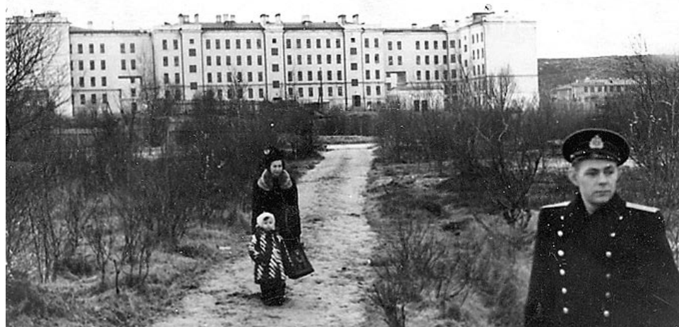
Городской парк в начале 1950-х. Дома №7, 9 и 11 стоят на ул. Сафонова с 1939-40 годов.

Подготовила Елена РОЩИНА.