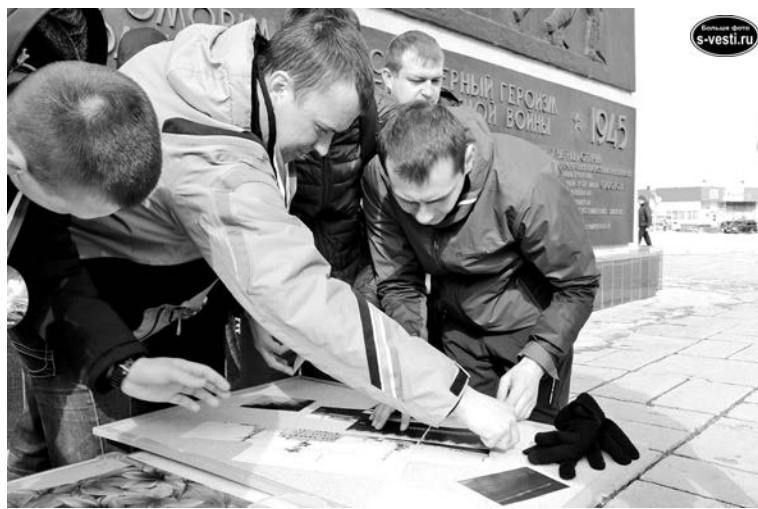
Команда «От винта» хоть и оперативно справлялась с заданиями, но в числе победителей не оказалась.

На церемонии награждения руководители команд, подготовившие участников к игре, были отмечены благодарностями, а сами команды грамотами от отдела молодежи, физической культуры и спорта администрации ЗАТО, а также памятными статуэт-