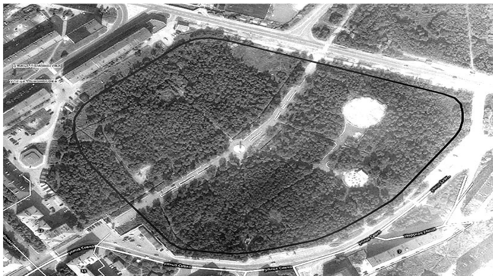
Городской парк, вид сверху. Черной линией обозначена будущая Аллея спорта.