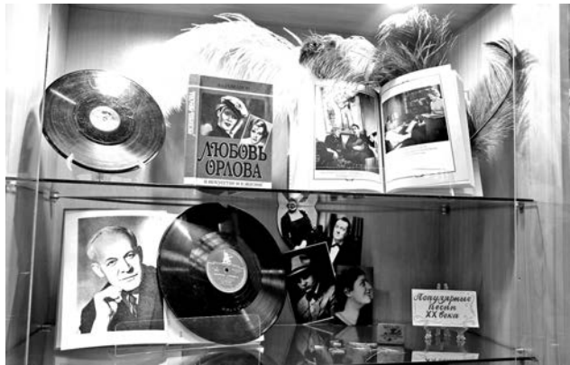
Стать соавтором экспозиции в библиотеке может каждый посетитель.

Любопытно, что библиотеки имеют сквозной проход и целый лабиринт подсобных помещений, в которых сейчас удачно располагаются единый и передвижной фонды Централизованной библиотечной системы.