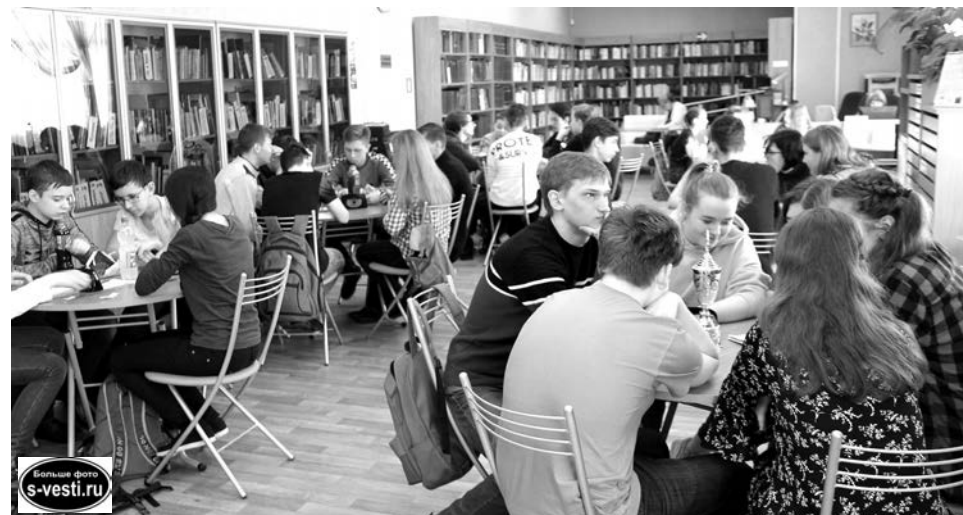
Идет минута обсуждения: на переднем плане с Молодежным кубком мира команда «МКТ».