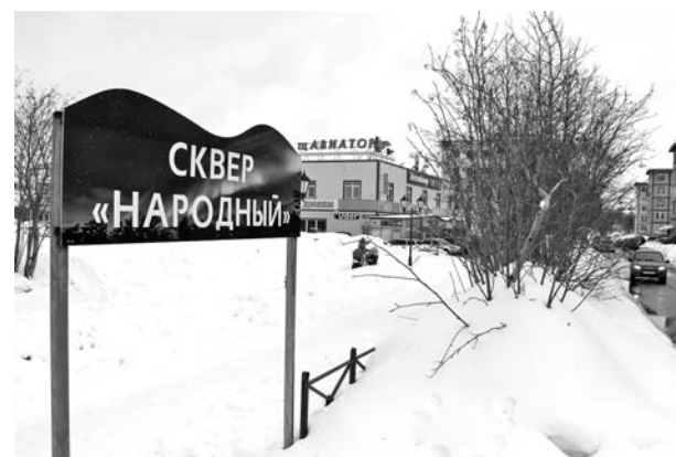
«Специалисты»: «Народное достояние».