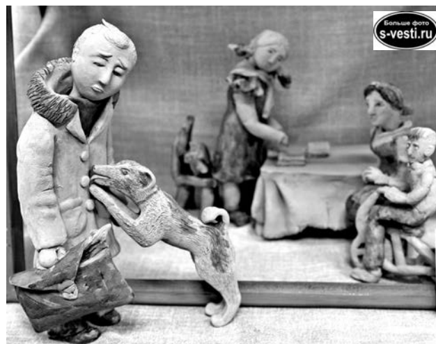
Картина Ф.Решетникова «Опять двойка» (керамика).