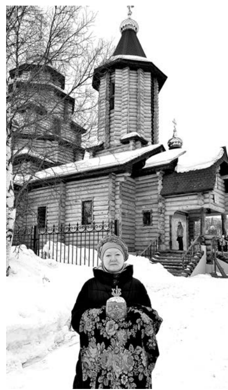
«Винтаж»: «Христос Воскресе!»

Вопрос про сквер «Народный» оказался интересным для меня. Мысль о сквере возникла сразу, но смущала фраза «приложили руки» в прямом смысле. «Приложить руки» - это фразеологизм, т.е. фраза употребляется в переносном смысле. Поделилась сомнениями с мужем. Тогда он мне и рассказал, как при открытии сквера прикладывали руки в прямом смысле. Я