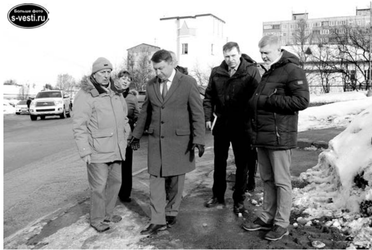
Участники рейда проверили и состояние тротуара на ул.Комсомольской, который накануне был вычищен до асфальта.