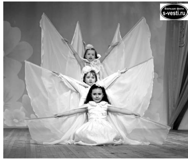
Юные воспитанницы д/с №11 представили композицию, посвященную маме.