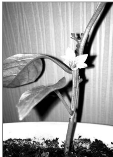
Наталья Афонина. - А это у нас цветет острый перчик Огонек - скромненько, но по-весеннему радостно.