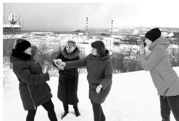
«МногоМамы»: «Репортаж с места событий».

Очень интересным стал вопрос с фотографией якоря, вопрос в стиле передачи «Что? Где? Когда?». Надо было зацепиться за ключевое слово «сегодня», подумать о праздниках (Пасха, день ПВО...) и начинать анализировать объекты. Еще не покидало ощущение, что этот якорь я где-то видела... В правильности решения убедилась только оказавшись перед храмом.