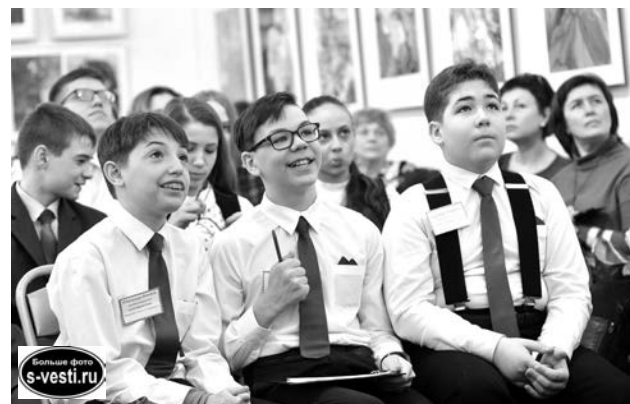
Победители в младшей возрастной группе – команда СШ №1 «Юные сивковцы».