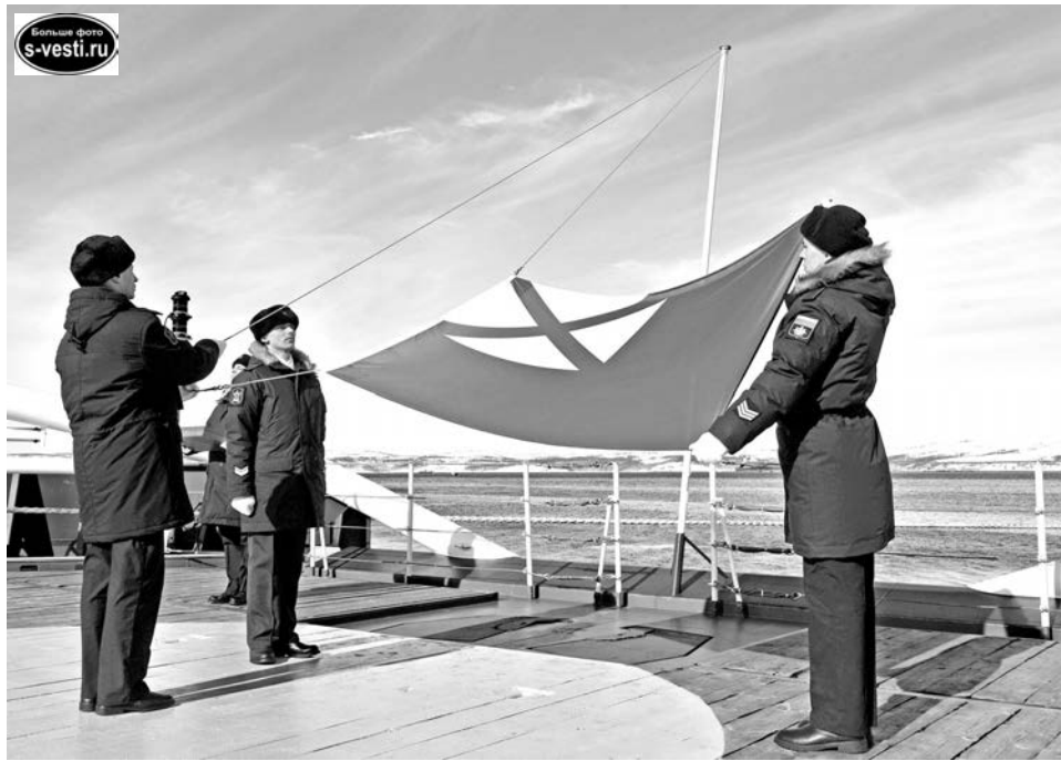
Под гимн России на судне «Эльбрус» впервые состоялся торжественный подъем флага вспомогательного флота ВМФ.

8 апреля в музее истории города и флота СМБК прошли викторина и награждение победителей городского конкурса знатоков культурного наследия города Североморска «Мужество, одетое в гранит».