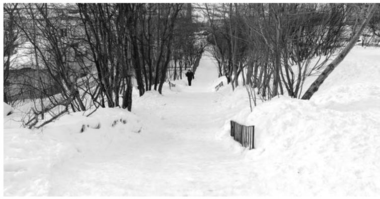
Лестница от дома №3 на ул.Комсомольской к школе полного дня больше похожа на горку.

Далее участники объезда отправились на ул.Инженерную. Здесь их интересовала детская площадка у дома №7, находящаяся на придомовой территории. Очевидно, что территория не видела лопаты дворника если не с начала зимы, то уже очень давно. Как пояснил генеральный дирек-