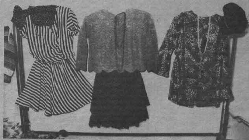
Нам - 50!