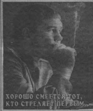
ХОРОШО СМЕЕТСЯ ТОТ, КТО СТРЕЛЯЕТ ПЕРВЫМ.