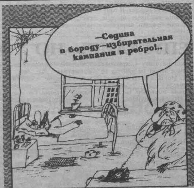
Рисунок Вячеслава ШИЛОВА