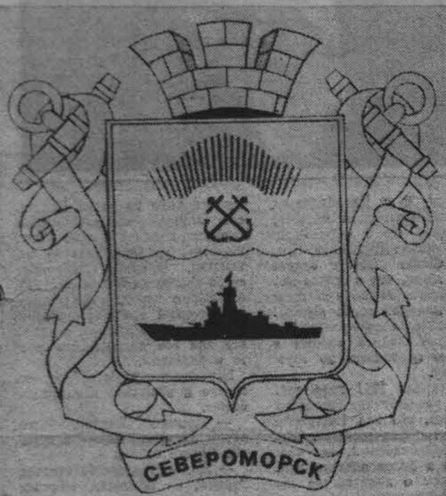
Рис. П. Абарина

Вы видите новый герб Североморска, так называемый полный герб. На заднем плане — два скрещивающихся золотых якоря, увитых красной лентой. Они символизируют приморский город-порт. Сверху — трехзубовая башня. По законам геральдики именно столько зубцов должно быть на башне в гербе города — районного центра, для областной столицы — 4, государственной — 5.