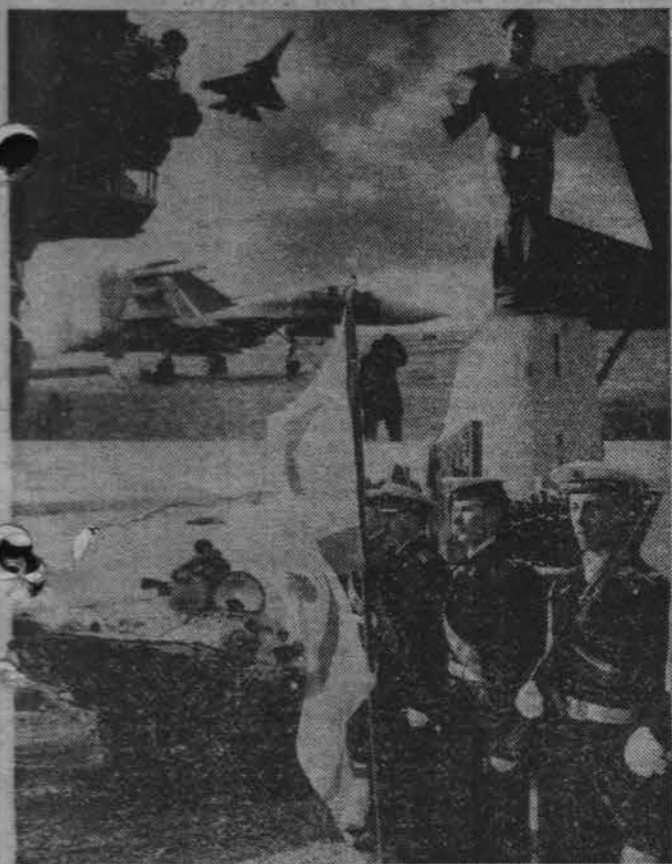
Отважны верные сыны. Коллаж Л. Федосеева.