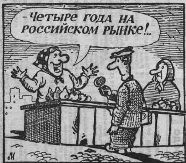
Рис. И. Левитина.