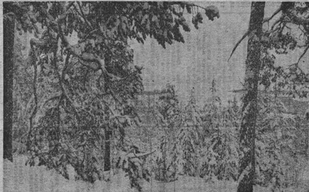
Зимняя сказка Заполярья.