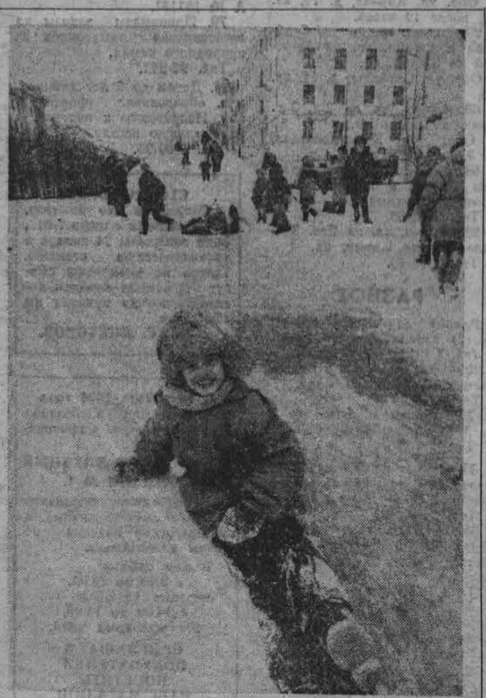
Новогодние праздники в Североморске кончатся тогда, когда с площади Б. Сафонова исчезают елка и снежный городок. Сколько радости местной детворе принесла нехитрая забава! Хорошо, если взрослые догадываются устроить для детишек горки во дворах. Зима-то еще не кончилась. А пока — вспомним...