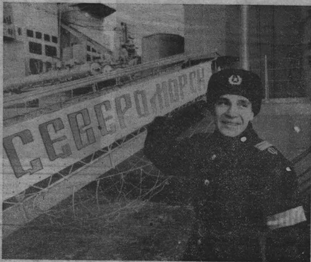
Добро пожаловать на БПК «Североморск».