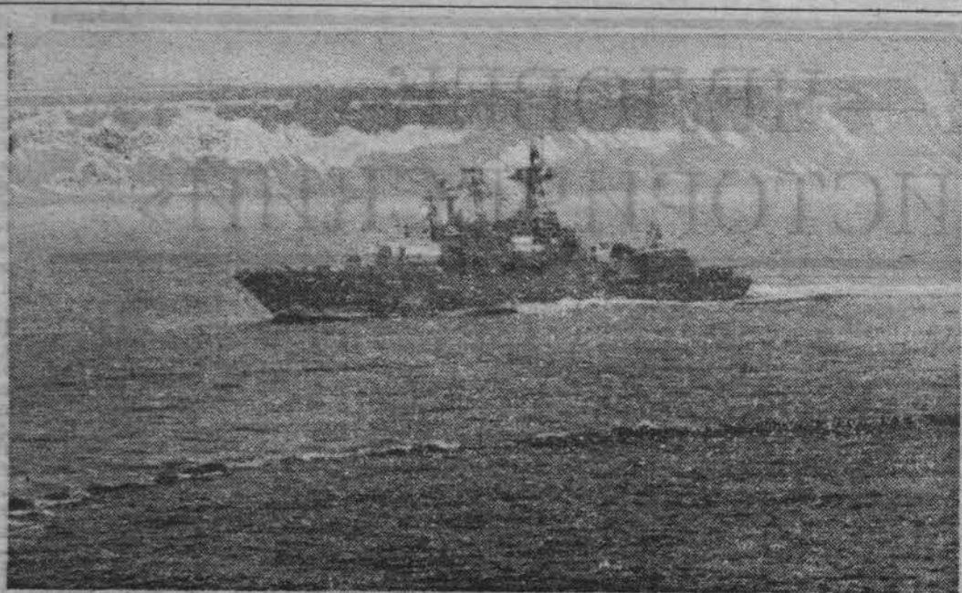
БПК «Североморск» в походе.