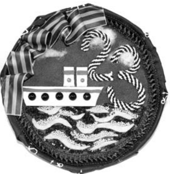
«С 23 Февраля!», Сережа Старшев, д/с №7, гр. «Лютики».