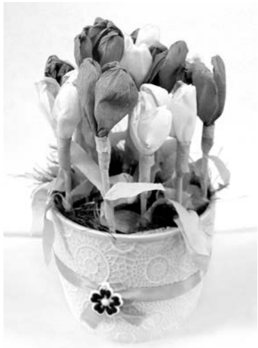
«Цветы для мамы», Настя Новикова, 6 лет, д/с №8, гр. «Выпускник», воспитатель Мария Замрыкит.

Победители будут известны уже на следующей «Большой перемене»!