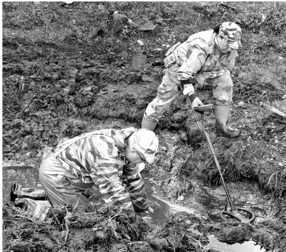
По колено в грязи ради истории - это не метафора.

и из альбома поискового отряда «Ваенга».