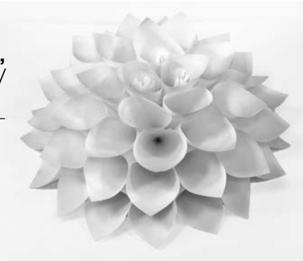
«Желтый цветок», Миша Денисов, 6 лет, д/с №12, гр. «Фиалка».