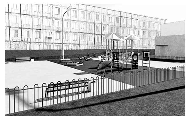
Это еще не проект, но примерный перечень того, что появится на детской площадке перед домом №14 по ул. Школьной.