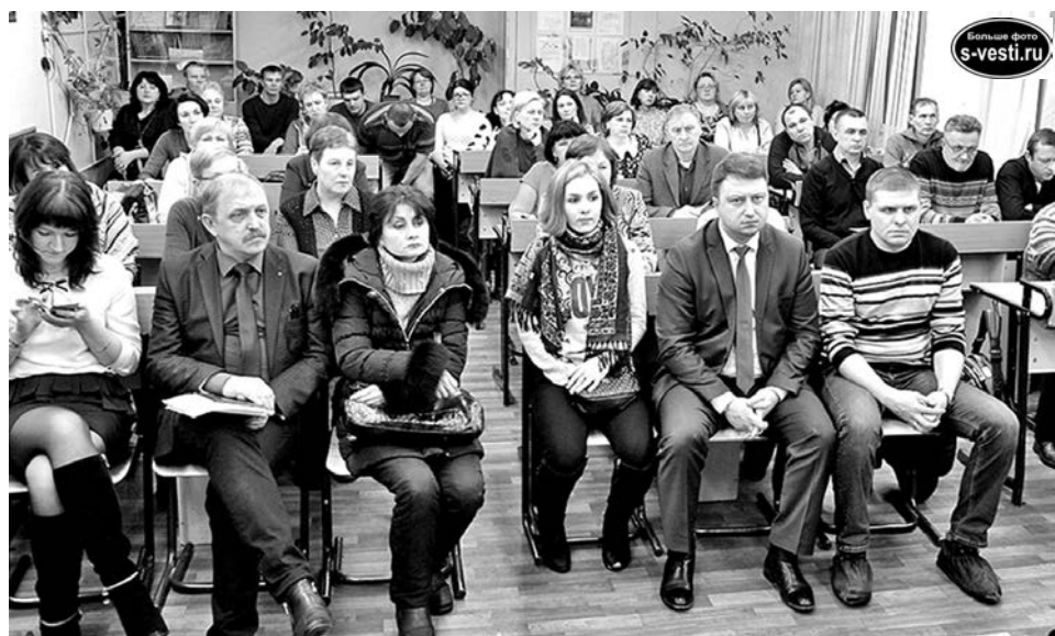
Общение с представителями власти вселило в сафоновцев надежду на лучшее и вызвало доверие.