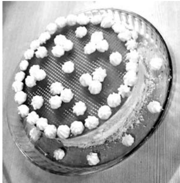
Кокосовый торт-суфле: минимум углеводов, без сахара и жира. Блинный торт.