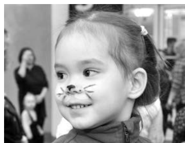
Побывать котятками захотели почти все девочки, пришедшие на выставку.

Также на выставке можно было смастерить игрушку для кота, нарисовать его портрет и даже самому