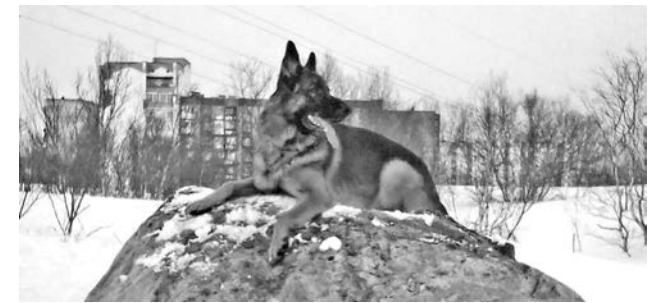
Год-другой - и Тунгус сможет тренироваться на безопасной площадке.

– На Заставе сложный рельеф. Да и как туда будут подгонять строительную технику? Говорят, за 4, 6-м домами. Но там давно огороды с клубникой и смородиной! На сопке с памятником оленю было бы гораздо удобнее. На огражденной сетке можно