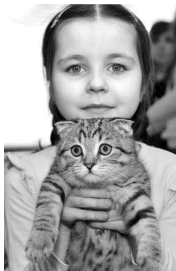
Порода не всегда защищает от бездомности.

превратиться в кошечку - мастера аквагрима помогли в этом превращении всем желающим.