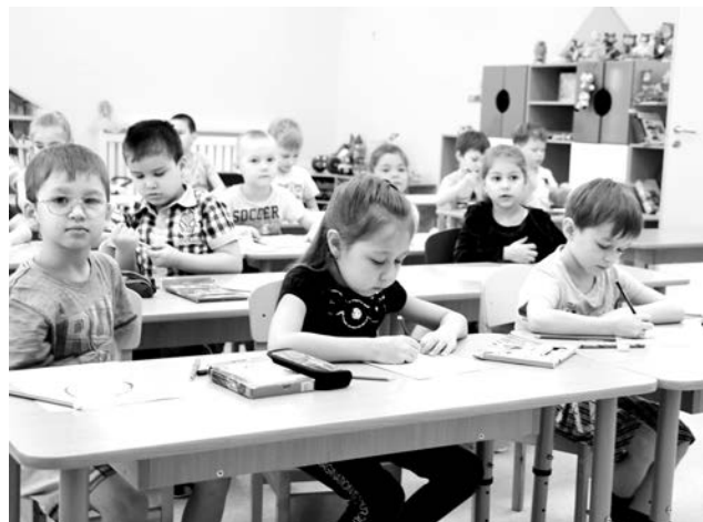
Детскую мебель можно регулировать под возрастные особенности ребят.