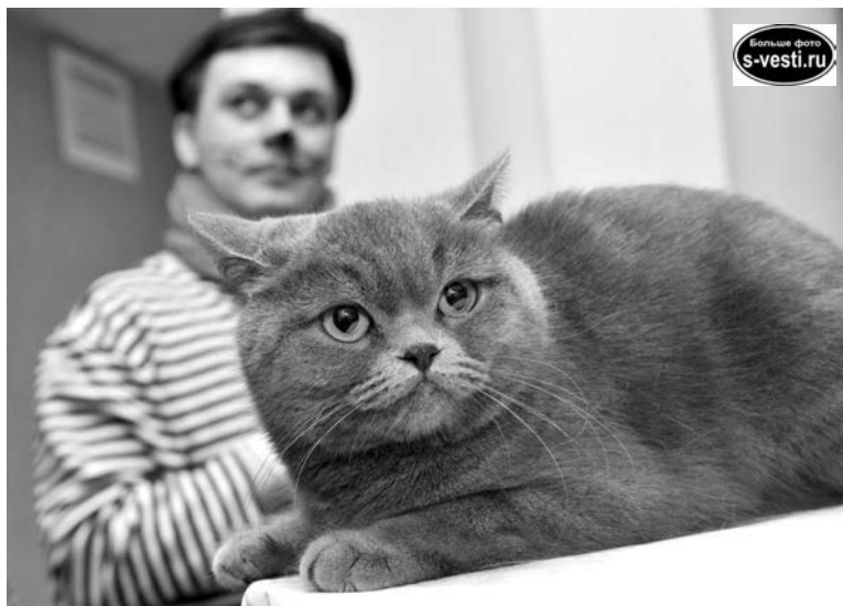
Домашний питомец может стать настоящим другом для всей семьи.