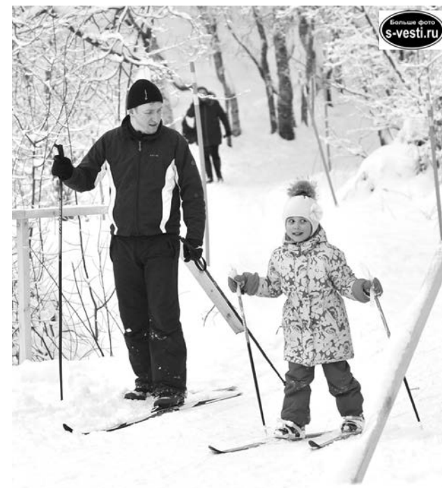
Опрос проводили Ирина КУЗЬМИНА, Любовь ЧЕБАНУ.

С IV в. 15 февраля отмечается Сретение Господне. В один из главных праздников Церкви оно превратилось после Халкидонского собора (451г.), в свете борьбы с монофизитством.