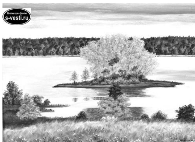
«Остров» (холст, масло), 2017г.