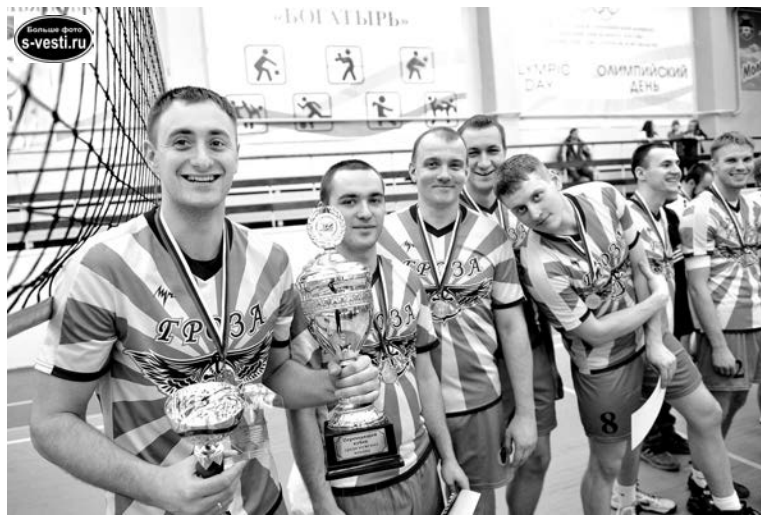
Переходящий кубок открытого первенства по волейболу остался у команды авиаторов «Гроза».

Особенно гостям понравилась игра с «Водоканалом» за второе место, где им удалось показать