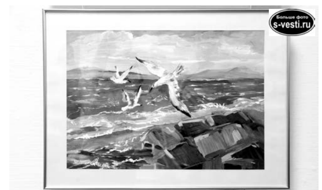
Н.А.Буданова, «Берег. Лазаревское» (бумага, гуашь).