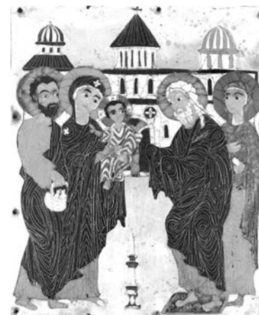
Средневековая грузинская икона Сретение.

Сейчас в России в этот день проходят «вечера встреч» выпускников воскресных школ, устраиваются чаепития, встречи с пастырями. Кроме того, появилась традиция проведения балов, где молодые верующие имеют возможность познакомиться, начать общение. Североморская епархия еще слишком юная и собственных традиций не обрела. Но православная молодежь города ездит ежегодно на сретенские