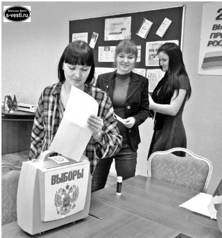
Все серьезно: опечатанный ящик для бюллетеней, тайное голосование - молодежная избирательная комиссия начала свою работу с внутренних выборов.