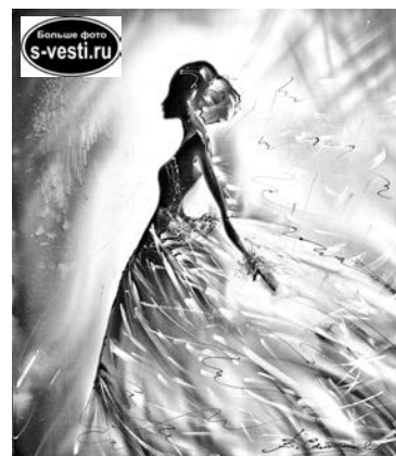
«Сцена» (атлас, смешанная техника).

будущих работ автор использует хлопок, сатин, атлас или шелк.