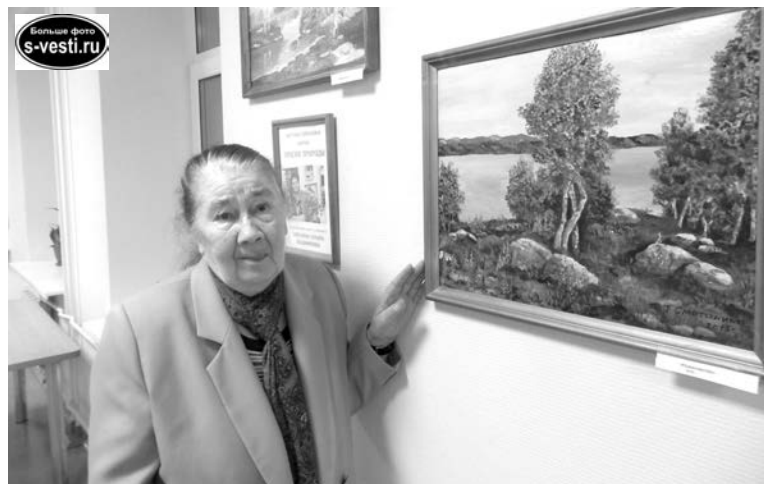
Пожилые «вышли на природу», не покидая здания.

Союз художников Североморска откликнулся на предложение Комплексного центра социального обслуживания населения ЗАТО, изъявившего желание принимать в своих стенах художественные выставки.