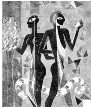
«Искушение. Адам и Ева».

Стиль арт-квилт, в котором работает мастерица, – это не привычные всем лос-