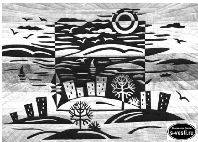
«Город у моря».