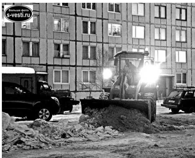
Снегоуборочный слалом: главное, не задеть личный транспорт.

Собранный в кучи снег нельзя более суток оставлять на территории дворов, несмотря даже на то, что многие из них тупиковые, а по-хорошему снег следует вывозить в тот же день.