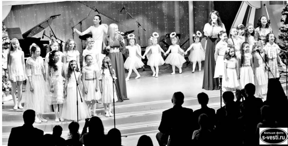
Вокальные группы «Конфетти», «Студио» и театр мод «Encanto» ЦДМ.