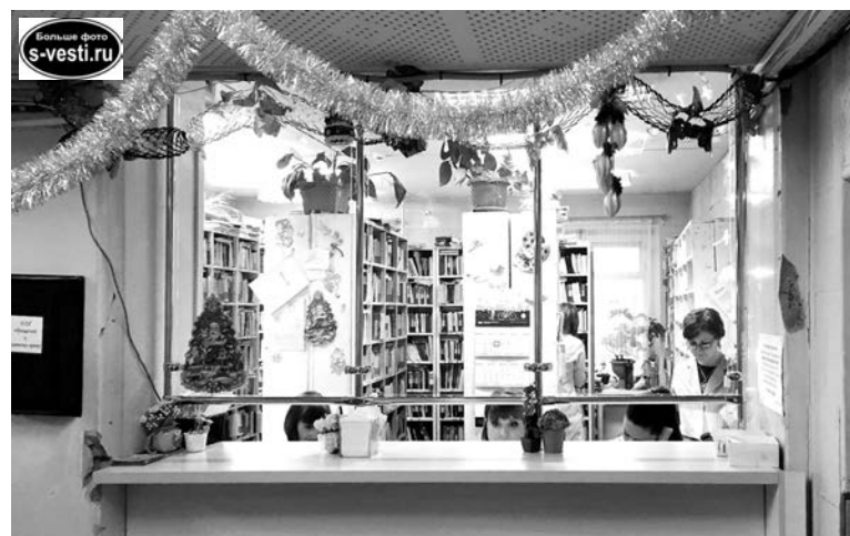
В новый 2018 год - с новой регистратурой.