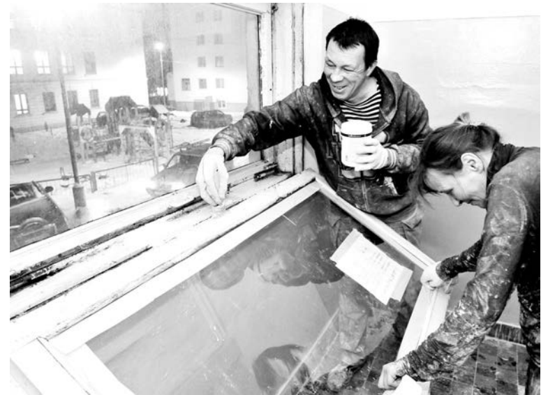
Работа подрядчиков в третьем подъезде по ул.Душенова, №15, подходит к концу - докрашивают рамы и перила.