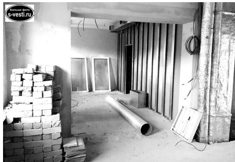
Для сдачи Североморской детской поликлиники в установленный срок препятствий нет: рабочей силы и строительных материалов у подрядчика достаточно.