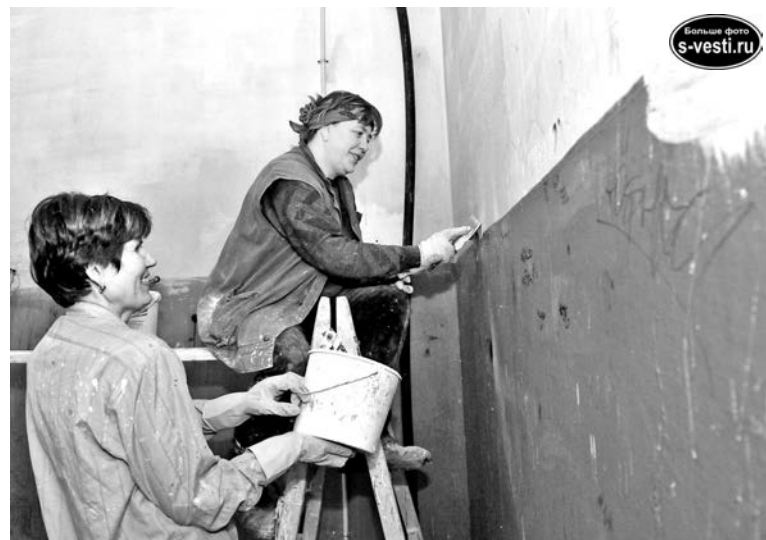
На ул.Кирова, 4, в третьем подъезде ремонтные работы в самом разгаре.

подъезды одного дома зачастую нереально. И пусть не чувствуют себя обделенными жильцы тех подъездов, где ремонт не сделан, а у соседей по дому выполнен. Просто, если мы сейчас сделаем ремонт во всех подъездах дома, то потратим все деньги, собранные с этого дома. А если кровля потечет, из каких средств будем ее ремонтировать?