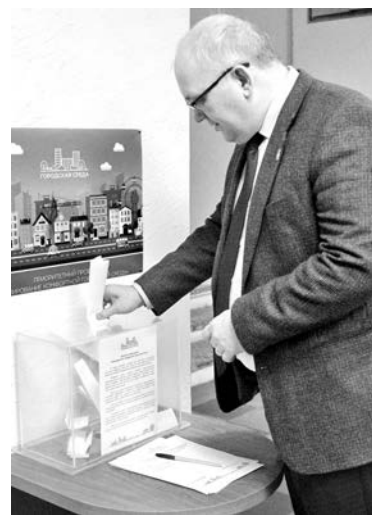
Урны с предложениями о благоустройстве вскроют через 3 недели.

- Не буду делать секрета, я отдал свой голос за освещение храмовой территории собора Андрея Первозванного. Периодически с таким предложением обращаются жители, я и сам столкнулся с этим в декабре, когда отмечался престольный