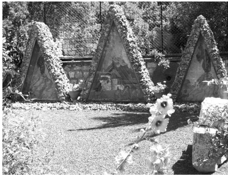
«Три кущи» на горе Фавор.

Иордан - здесь принял крещение Иисус Христос. В Иордане обязательно купаются все паломники, причем, строго в белых рубахах. В чем-то Иордан сумел сохранить первобытность. Когда заходишь в воду, ноги облепляют стаи мелких рыбешек. Рядом - целая колония водяных крыс, тут же плавают здоровые сомы. Непуганные выдры выплывают на берег, подходят вплотную. Позируют. Да их тут на целую шубу! Делаю фото на память.