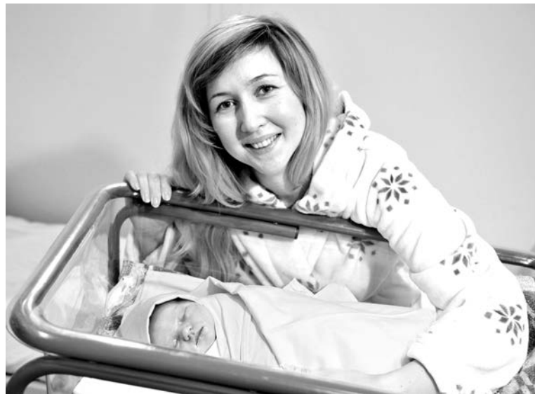
Малышка родилась ростом 52 см и весом 3210 гр. Мама с дочкой чувствуют себя замечательно.