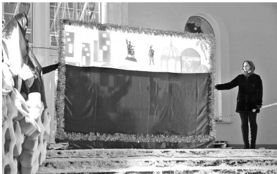
По сложившейся в Североморске традиции, Рождественское представление готовит Центр досуга молодежи.

Рождество и сегодня находит отражение в нашей жизни, с ним, например, связан календарь. В Римской империи в IV-VI вв. отсчет времени производился от года воцарения выдающегося императора Диоклетиана (284г.). Этот год был точкой отсчета новой эры - «эры Диоклетиана». В Церкви ее называли «эрой мучеников», потому что данный правитель был жестоким гонителем христиан. К VIв. христианство получило государственное признание. Папа Римский поручил ученому монаху Дионисию Малому составить пасхальную таблицу на последующие годы, при составлении которой тот посчитал дурным тоном вести отсчет от воцаре-