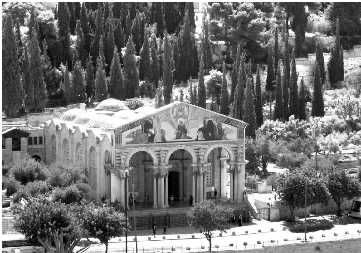
Храм всех наций или Базилика Агоии в Иерусалиме.