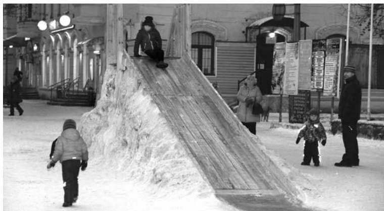
Горка на ул.Сафонова уже около двух недель радует детвору.

- Также мы займемся освещением лыжной трассы в городском парке. Оно будет проведено по аварийной схеме, так как отсутствуют столбы наружного освещения. Кроме того, трасса будет украшена еще 20 цветными светя-