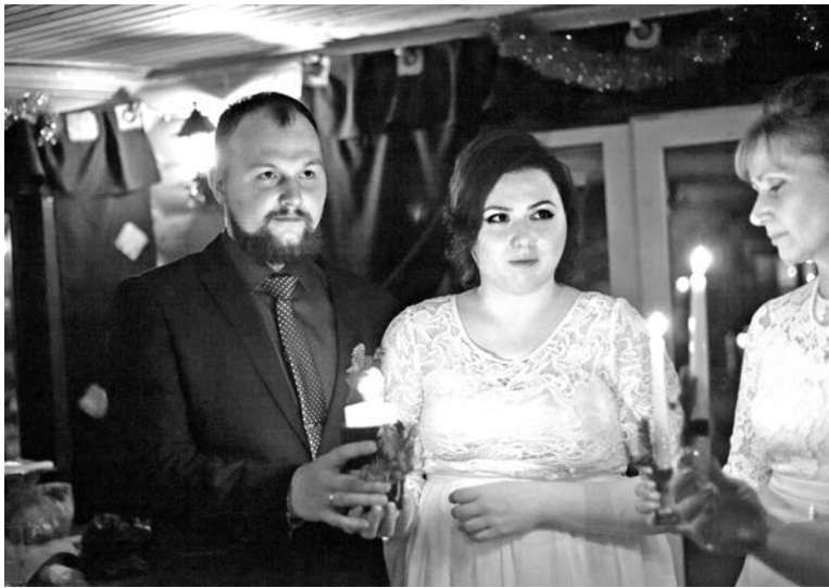
Молодожены глазами фотографа Анны Медведевой.

Досужий вопрос «когда уж замуж?» в свое время так надоел Инне Калюжной, что на очередное нескромное любопытство она начала отвечать: «Когда соберусь - весь город будет знать!»