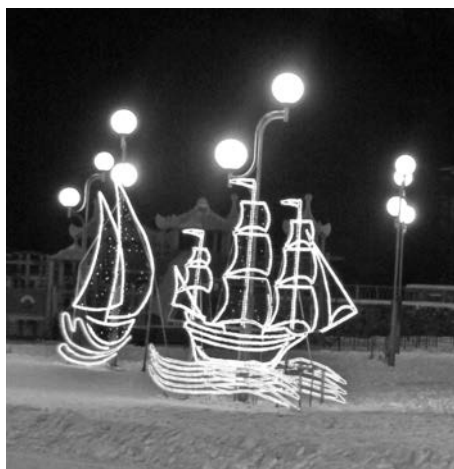
Светодиодные конструкции светят ярче, а энергии потребляют меньше.