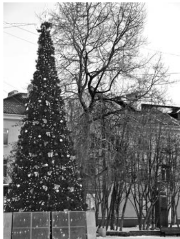
На ул.Сафонова монтаж праздничной иллюминации завершается.