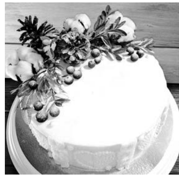
Выигранный торт Левашины привезли в библиотеку: коллеги заслужили!

Свою Зимнюю сказку ребята вспоминают с большой теплотой: единенную атмосферу загородного парка, продуманное до мелочей оформление праздника, роскошные свадебные торты, выдержанные в едином зимнем стиле букеты и бутоньерки. В теплом палантине глубокого