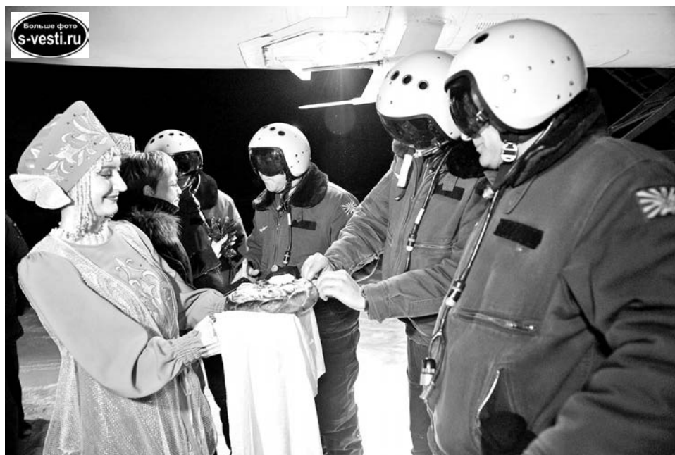
По русской традиции летчиков (верхняя часть лиц в целях безопасности закрыта очками) встретили хлебом-солью.

Заполярье бомбардировщики Ту-22М3, действовавшие с аэродромов на территории Российской Федерации, за последний месяц нанесли 14 групповых