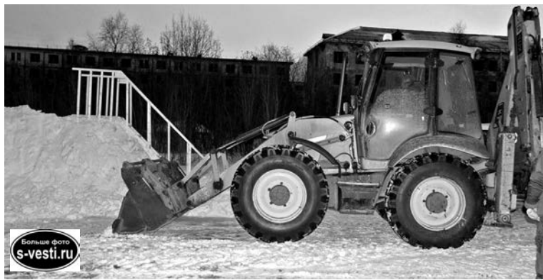
У юных жителей п.Сафоново-1 скоро тоже будет горка.