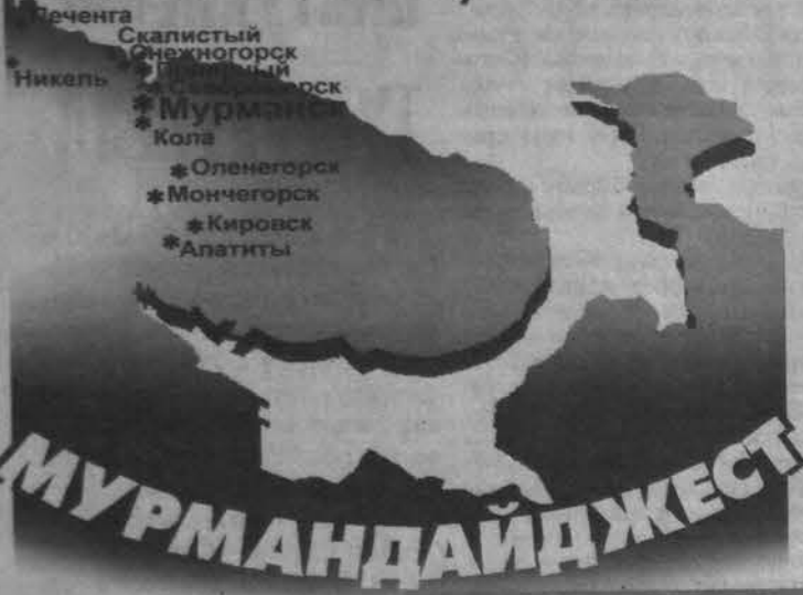
Вести Северо-Запада России