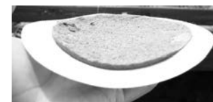
Традиционная демонстрация грязного фильтра продавцом.

Во-первых, не использовать купленный пылесос и взяться за решение проблемы как можно быстрее, а не