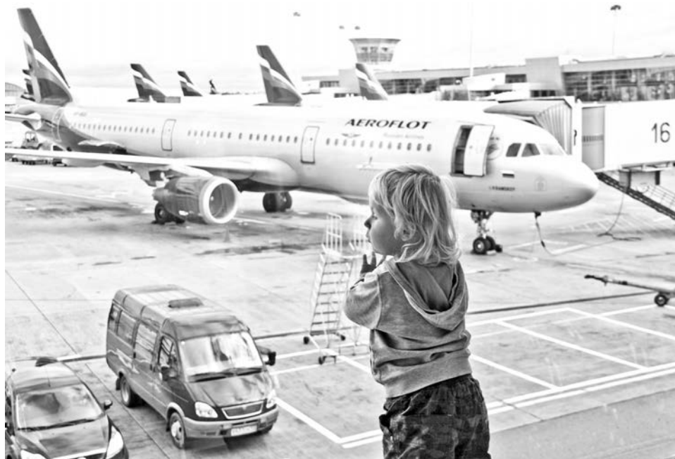
По мнению Романа Поликарпова, самолет и ребенок - самое прекрасное, что есть на свете.

Из примерно 30 фотографий большая часть - это некий репортаж из мест, которые доступны всем авиапассажирам. У ав-