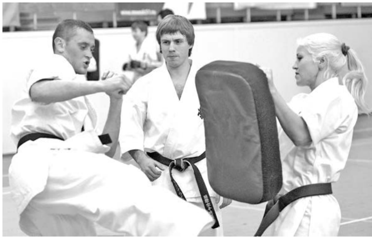
Во время мастер-класса Роман Узунян (в центре) старался уделить внимание каждому спортсмену.

Учебно-тренировочные сборы – событие для спортсменов рядовое. Но для североморцев, занимающихся кекусинкай карате, недавние сборы в СК «Богатырь» стали особенными, потому что прошли под руководством многократного чемпиона России, Европы и мира в этом виде боевых искусств Романа Узуняна.