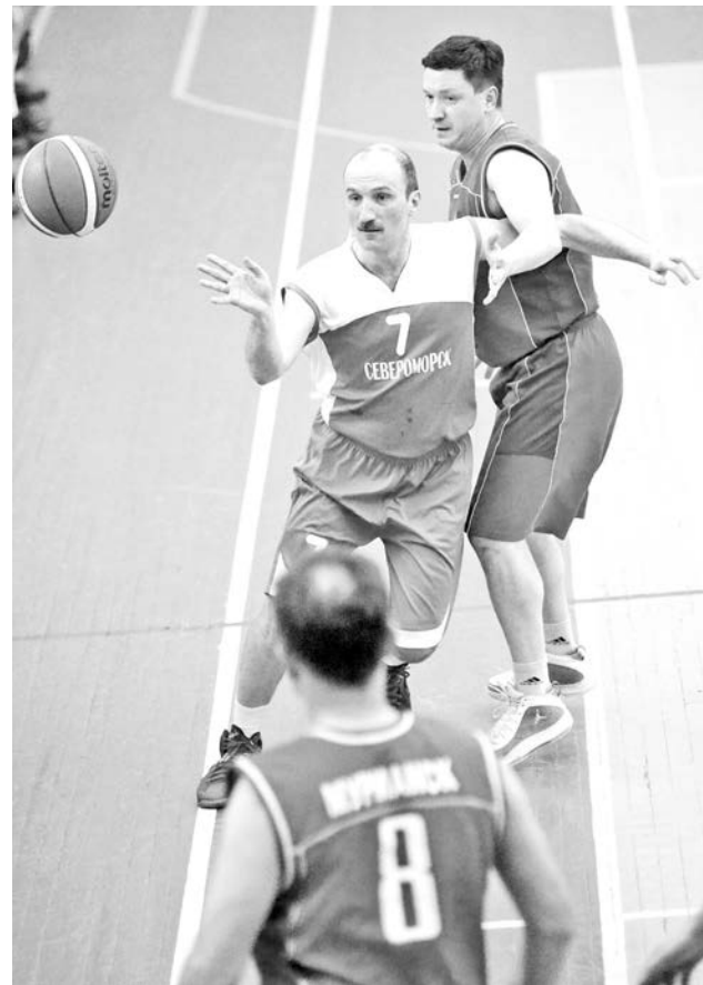
Как ни боролись североморские ветераны, мурманчане своего не упустили.

Не помогли родные стены и мужской команде. Из всех трех встреч, которые болельщики могли увидеть в этот день, именно мужчины продемонстрировали наибольшую ре-