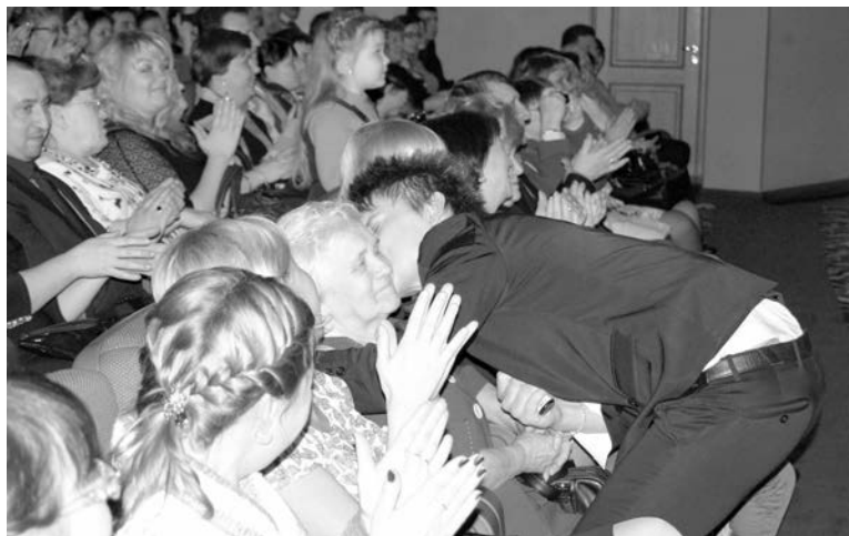
«Нанайцы» с удовольствием шли в народ: спускались в зал и раздавали автографы.