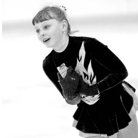
Комплимент от болельщиков - шоколадки и мягкие игрушки.