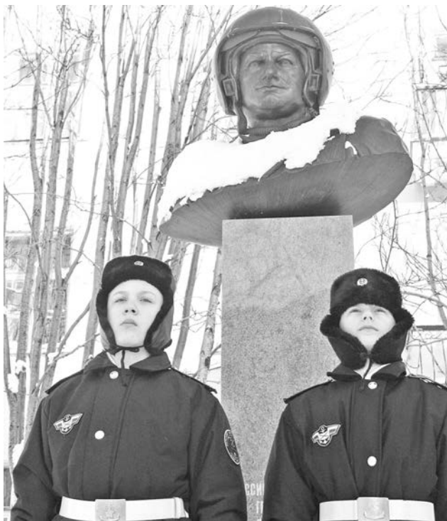
Несмотря на юный возраст, курсанты ДМЦ всегда относятся к Вахте Памяти по-взрослому.

В 1991 году Апакидзе одним из первых строевых летчиков произвел посадку на палубу авианосца «Адмирал Флота Советского Союза Кузнецов». Всего он совершил 236 посадок на палубу, освоил 13 типов самолетов, налетал