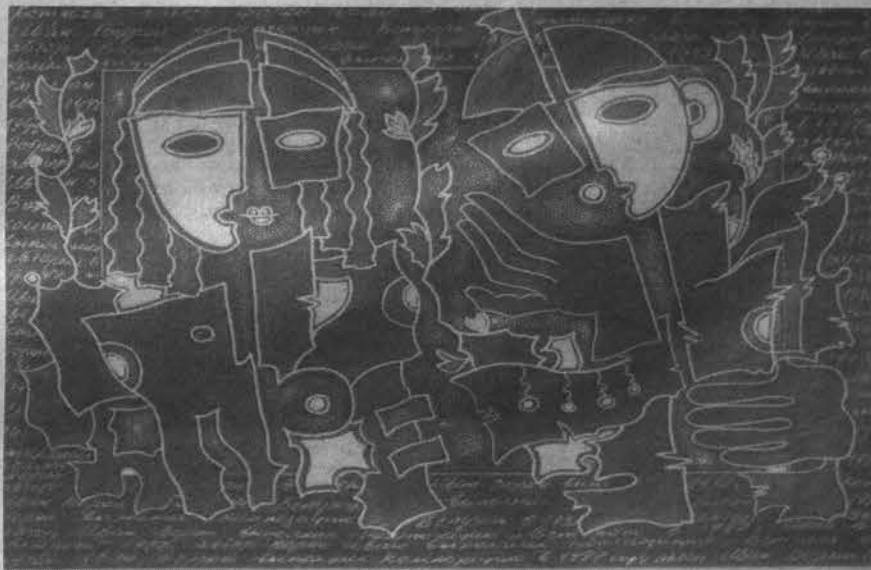
Иван ВОРОН. "Встреча". (1997 г.)

Желтый цвет олицетворяет землю. И как та постоянно требует ухода, чтобы не превратиться в пустыню, так и подобные люди оказываются эгоистами: постоянно требуют к себе внимания и любви. Я отнес их к "комплексу вампира", потому что считаю очень опасными: поймав кого-то в свои сети,