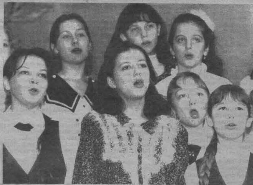
НА СНИМКЕ: участники хора Североморской детской музыкальной школы.

5 апреля в Детской музыкальной школе прошел областной семинар преподавателей-хормейстеров на тему "Хоровое многоголосие: гомофония (деление голосов на главный и сопровождающие) и полифония (слитное, равноправное их звучание)".