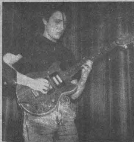
(Окончание. Начало в №9.)