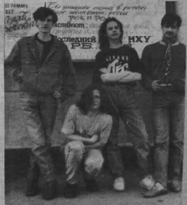
Теперь не вспомнить, как падал я на дно, До одури глотая небеса.

И все, что будет, Давно уже прошло Под спицами слепого колеса.