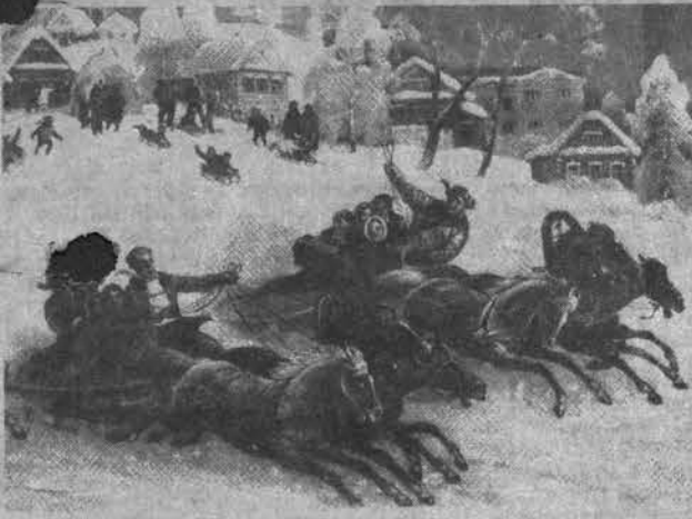
Они хранили в жизни мирной Привычки милой старинной. У них на масленице жирной Водились русские блины. А.С. Пушкин

предпасхальный семядельный Великий пост. Таким образом, по православной пасхалии Масленица приходилась на вторую половину февраля - начало марта.