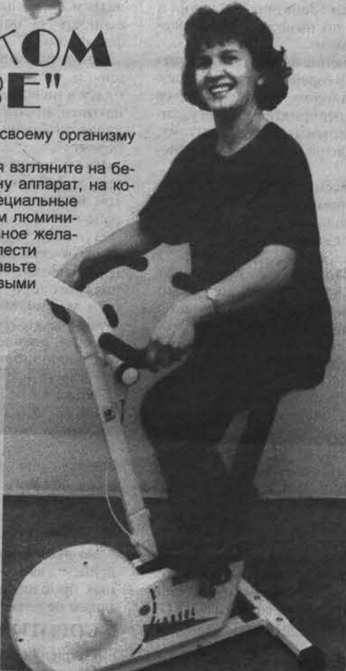
На снимке: на тренажере "Кеттлер".