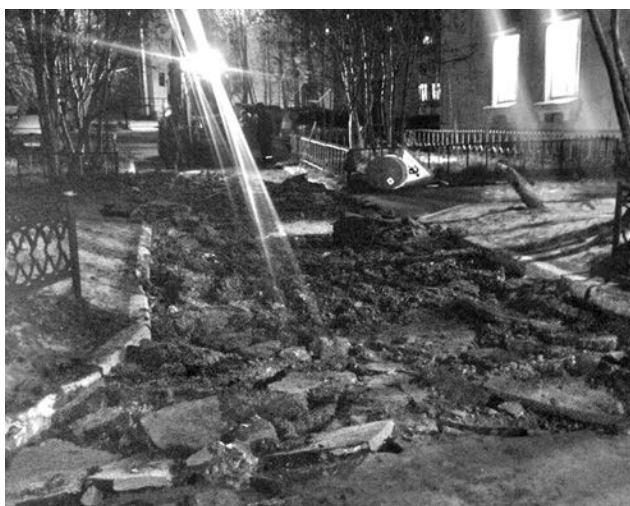
Недостатки после ремонта дворового проезда между домами №18 и 20 по ул. Сафонова устранили еще в ноябре.

Комитетом по развитию городского хозяйства администрации ЗАТО г. Североморск было установлено, что один из хозяйствующих субъектов (пока не называем, надеясь, что они исправятся) не выполнил свои обязательства, связанные с исполнением разрешения, выданного Комитетом, на вскрытие дорожного полотна. После проведения ремонтных работ организация не привела в порядок асфальтовое покрытие на улицах Головки, Падорина, Сизова и возле дома №2 по ул. Сафонова. За допущенные нарушения статьей 2 Закона Мурманской области от 06.06.2003г. «Об административных правонарушениях» предусмотрен штраф в размере от 10 до 30 тыс. руб-