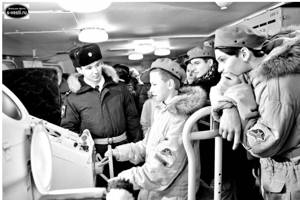
Став юнармейцами, мальчишки получили возможность оказаться за штурвалом авианесущего крейсера «Кузнецов».