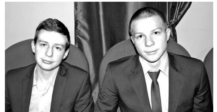
Полосу подготовил Игорь ГЛУЦКИЙ.

- После 9-го класса мы все повзрослели, сплотились, стали как одно целое, готовы сопереживать друг другу, заботиться, школа играет в нашей жизни очень большую роль, - добавил Виктор.