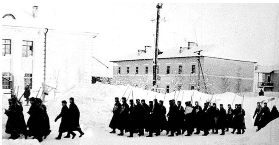
Февраль 1963 года. По ул.Советской перед семилетней школой №7 и домом №21а (справа) идут военнослужащие с лопатами наперевес. Чистить улицы от снега выходили целыми ротами.

Достопримечательностью двух улиц с 1951 года стал фонтан - первый в Североморске. Конструкцию в виде вазы из бетона отливали в УНР отделочники СВМС. Струя воды, по воспоминаниям старожил, достигала 8-метровой высоты. У дома №24 по ул.Советской в колодце был кран для включения воды на фонтан. На благоустроенном участке по периметру были газоны, однако они вытаптывались детьми и... лошадьми. Стреноженные лошади приходили в белые ночи попасть на травке, а утром стройбатовец собирал их и уводил. Периодически газоны восстанавливали, подсыпая землю пополам с перепревшим навозом, и засеивали. Позже установили деревянное ограждение участка. С 1954 года рядом с домом №24 по ул.Советской открылся детский сад №1 «Теремок» СВМС - и участок с чашей фонтана