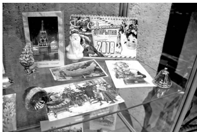
Помимо росписи игрушек, участники могли ознакомиться с выставкой винтажных открыток прошлого столетия.