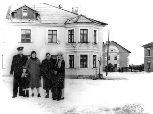
Фото Владимира Охрименко 1967г.: на снимке отец Владимира и их соседи по дому №27а по ул.Советской вышли посмотреть на праздник «Проводы зимы».

Наталья СТОЛЯРОВА. Фото из архивов старожилов Североморска.