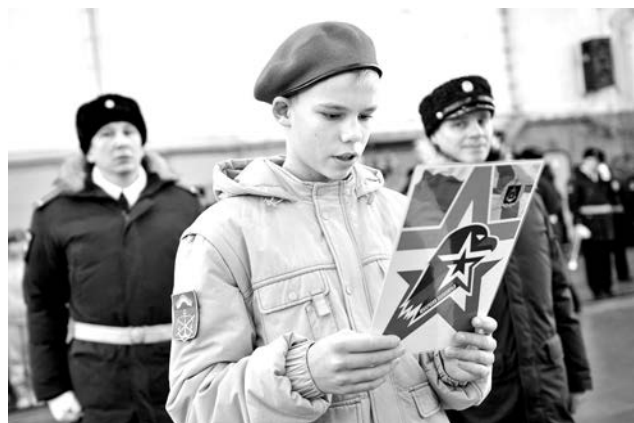
Давать клятву на верность Отечеству и юнармейскому братству, когда ее принимает Герой России капитан 1 ранга Алексей Дмитров (на фото справа), вдвойне ответственно.