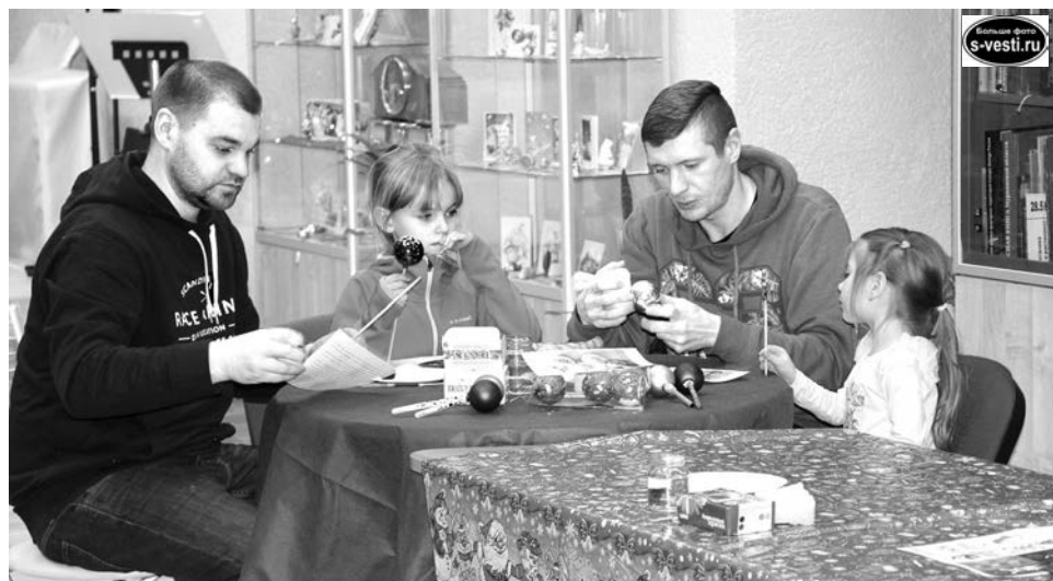
На мастер-классе папы тоже не сидели без дела и помогали дочерям делать ёлочные украшения.