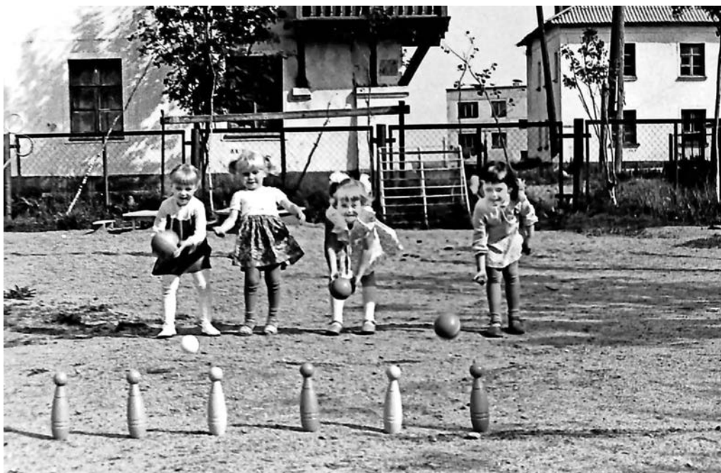
Фото Чернявского 1982 года. Участок детского сада СВМС «Теремок», располагавшегося в доме №22а по ул.Северной.