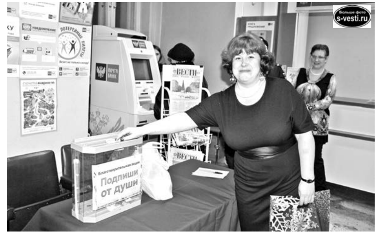
Оксана Федорова пополняет благотворительный ящик-копилку.

– «Североморские вести» выписывали мои родители. Но потом они переехали в Тверь, и я «унаследовал» от них газету. Позже подписался с доставкой