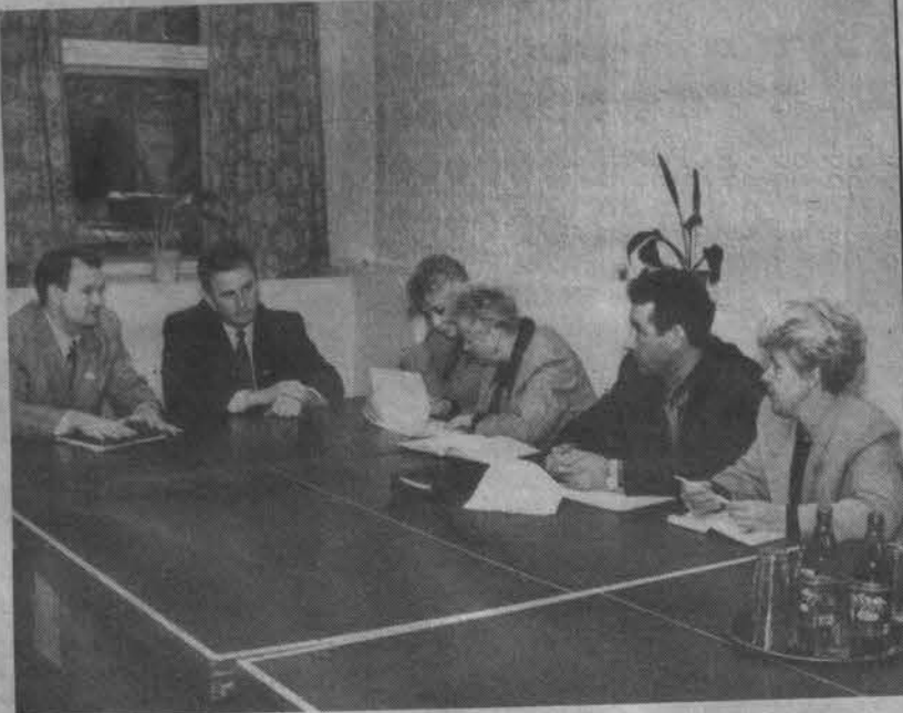
Депутаты горсовета: поиск выхода из ситуации.

тился к депутатам за помощью. Он настаивал на том, чтобы при формировании городского бюджета на 1999 год были учтены пожелания работников предприятия и предупреждал о возможном сокращении городских автобусных маршрутов, с тем, чтобы использовать транспорт для междугородних перевозок. Они давно доказали свою рентабельность.