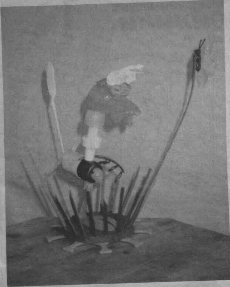
«Павлин на охоте».