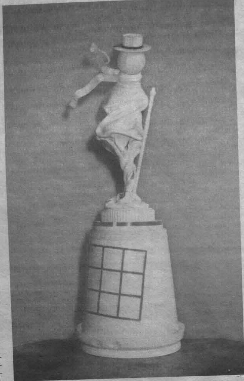
«Памятник свободному художнику».

- Подобное направление мне не подходит. Я не чувствую связи полотна с материальным предметом - по своей природе они противоположны. В любой работе должна быть гармония, основанная на совместимости различных деталей по фактуре. Необходимо еще учитывать и пространственный эффект: либо это целиком плоскостное решение, либо объемное. Иначе внимание зрителя обратится только на барельефную часть, а все остальное выпадет из поля зрения и как бы перестанет существовать. Эксперименты с продуктами считаю без-