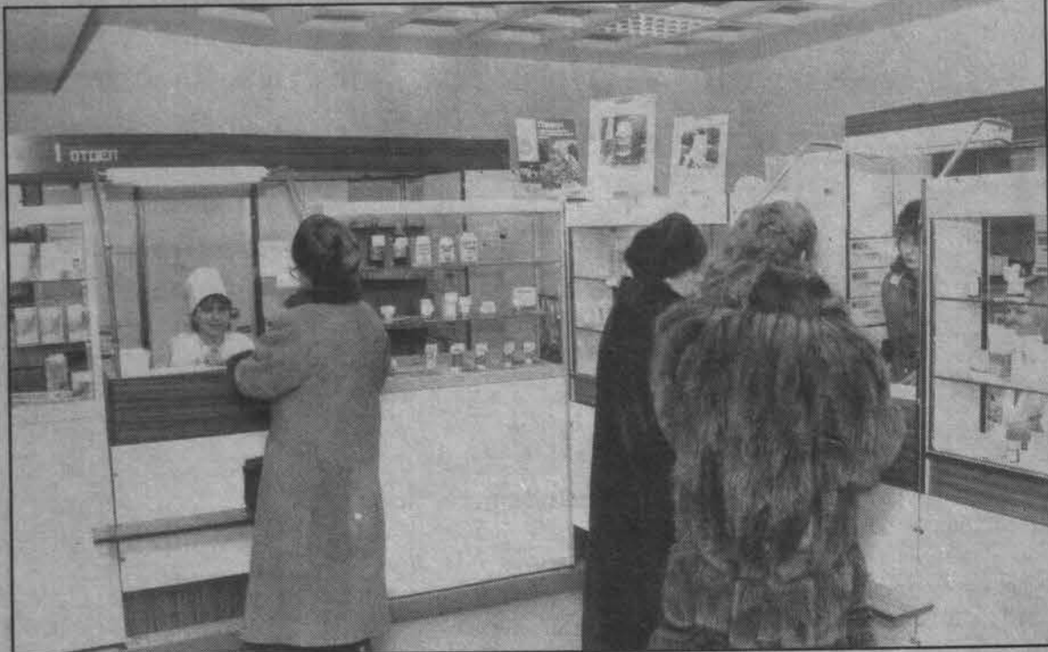
В аптеке № 31.