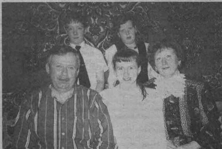
Вот мы какие...