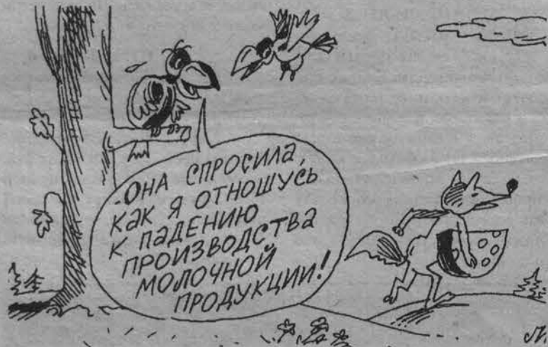
Рис. Игоря ЛЕВИТИНА