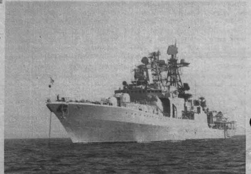
БПК «Адмирал Левченко».

Гордятся «Адмиралом Левченко» не только на флоте, но и шефы корабля. С марта 1995 года завязалась дружба североморцев с