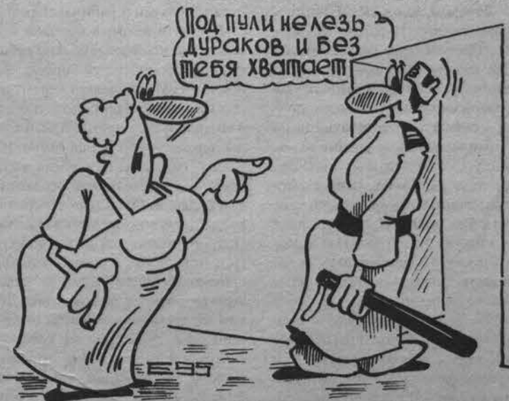
Рис. В. ЕВТУШЕНКО.

по ул. Гаджиева, при неизвестных обстоятельствах пропала автомагнитола стоимостью 80 рублей. Об этом заявил в милицию хозяин машины - гражданин Г., 1953 г.р. Проводится проверка.