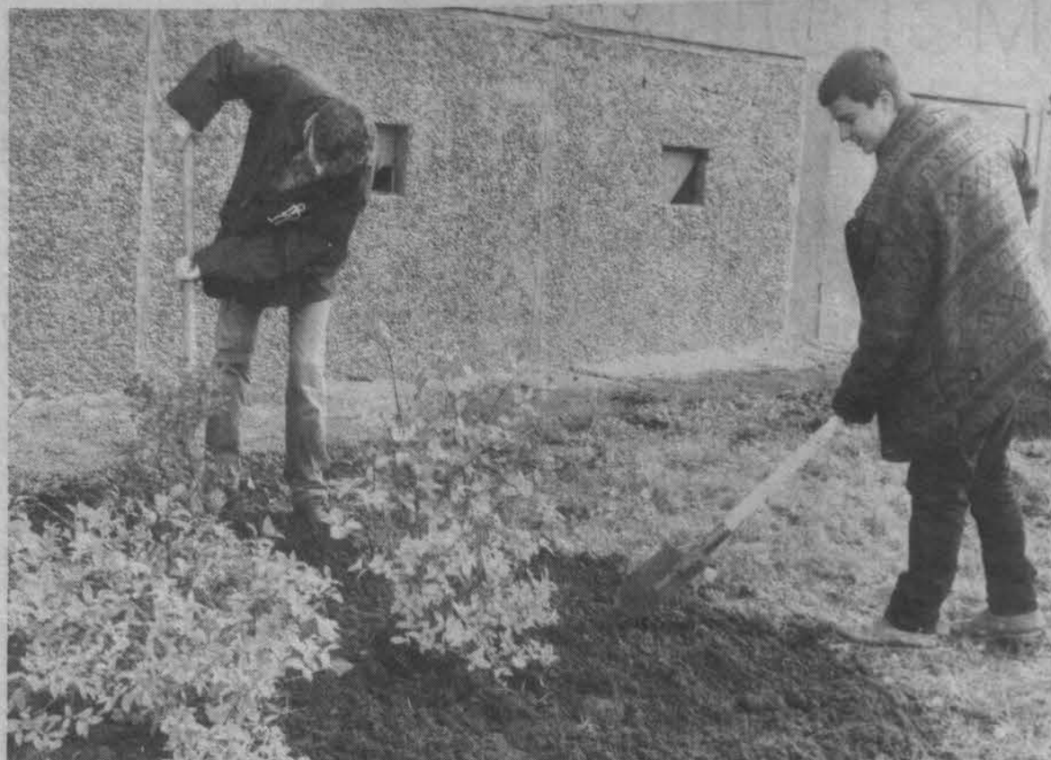
Совместим полезное с приятным.

Как и предполагалось, оплата труда производилась с использованием системы взаимозачетов с предприятиями-должниками в фонд занятости населения. Израс-