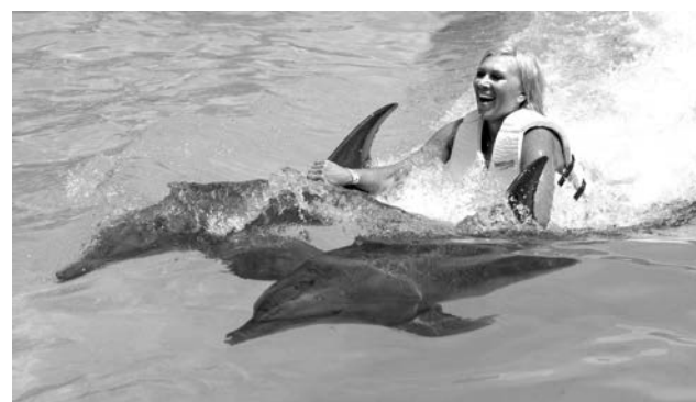
В Канкуне дельфинарий расположен в открытом море.

полнят «Подмосковные вечера» или «Quantanamera». Национальный колорит присущ католическим церемониям, которые тоже проходят весело, сопровождаясь песнями.