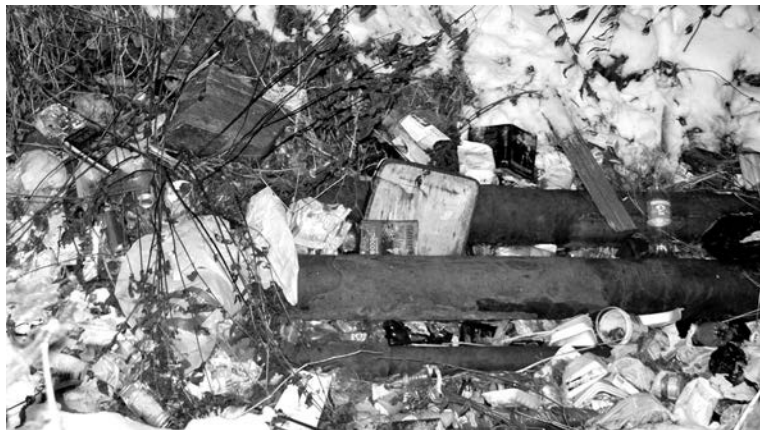
Захламленный жителями открытый участок теплотрассы.