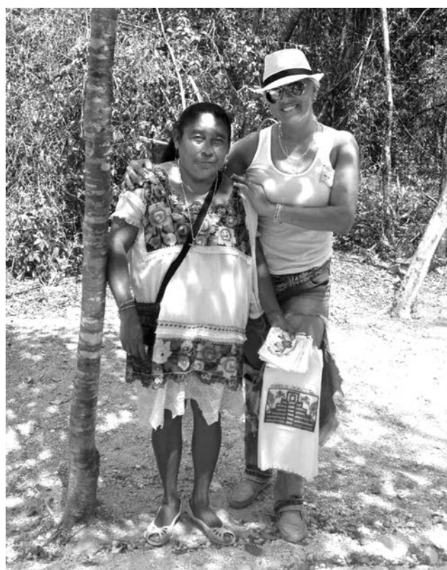
С женщиной из племени майя.