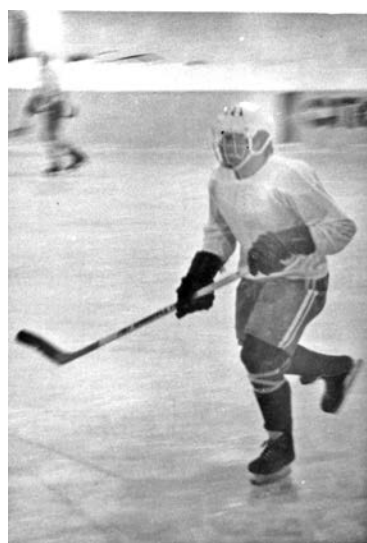
Фото 1987 года из архива Юрия Костырева.

Собрать еще раз городскую команду возможно, но кто из игроков захочет покинуть сплотившиеся коллективы? К тому же городских площадок для трениро-