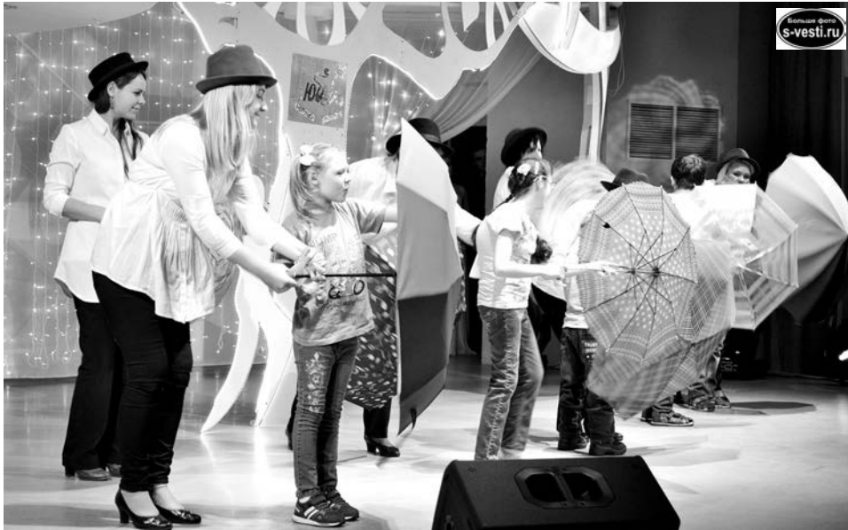
Коллектив «Синяя птица» Мурманской региональной общественной благотворительной организации «Радуга».