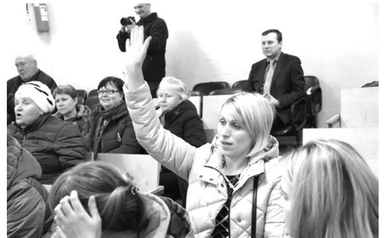
Почти каждый житель п.Щукозеро подготовил для встречи с главой ЗАТО свой вопрос.