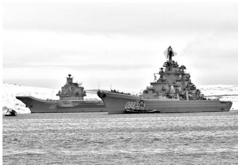
Могучие боевые корабли Северного флота известны всему миру и уважаемы нашими иностранными партнерами. Ими гордятся не только служащие здесь моряки, но и жители Североморска. К своему 20-летнему юбилею, который состоится 18 апреля 2018 года, крейсер «Петр Великий» продвигается уверенно, приумножая достижения. По итогам 2017 года он признан лучшим надводным кораблем Северного флота.

Ольга ВОРОБЬЕВА.