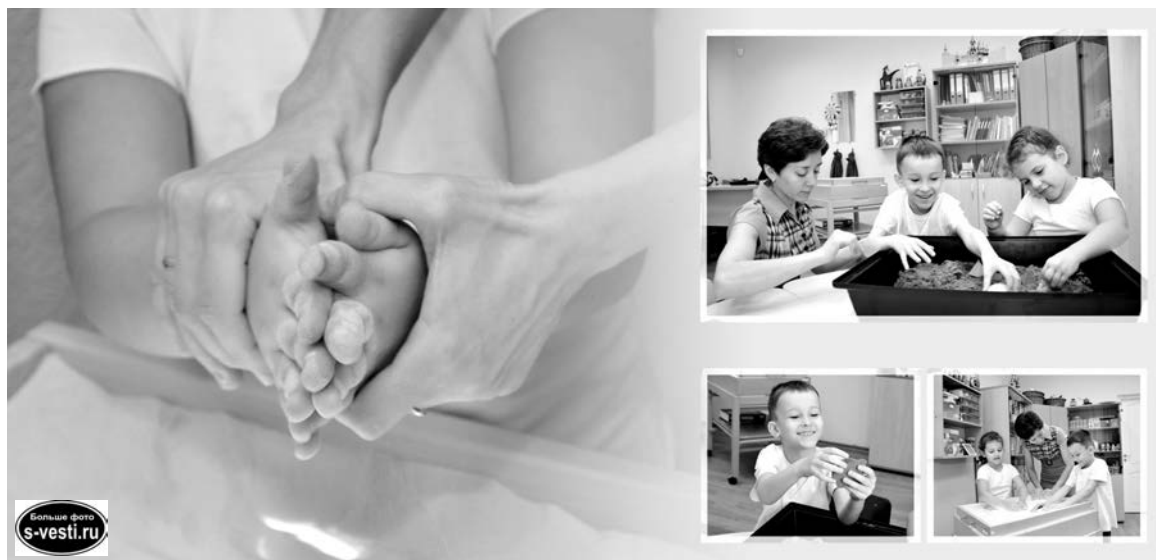
Занятия с кинетическим песком увлекательны и познавательны, они развивают усидчивость и мелкую моторику.