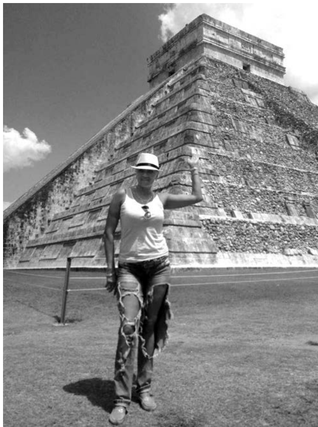
В Чичен-Ице у пирамиды Кукулькана.

В культурной туристической программе особняком стояло посещение древнего каменного, хорошо сохранившегося города Чичен-Ица, входящего во Всемирное наследие ЮНЕСКО. Он был основан племенами майя примерно в 700 году и расположен в двухстах километрах от Канкуна. В XI веке население из него ушло, город был частично разрушен. Из числа сохранившихся памятников стоит отметить девятиступенчатую 24-метровую пирамиду Кукулькана, обсерваторию «Караколь», храм воинов, а также 7 стадионов для игры в мяч. Самый большой длиной 135 метров, с ограждением и ложей для зрителей. Игра-