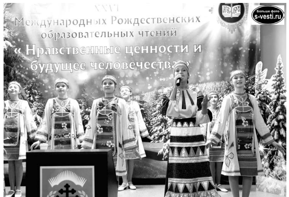
Открыл чтения, покорила зрителей, образцовый детский ансамбль народной песни «Родничок».