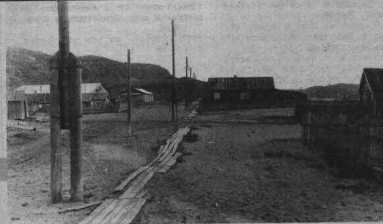
Досчатые тротуары Териберки.