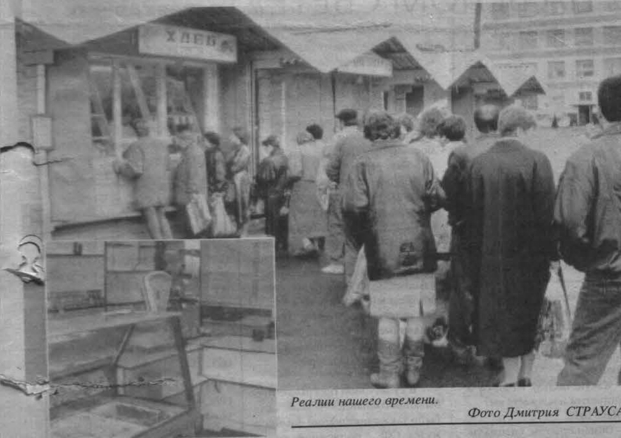
Реалии нашего времени.