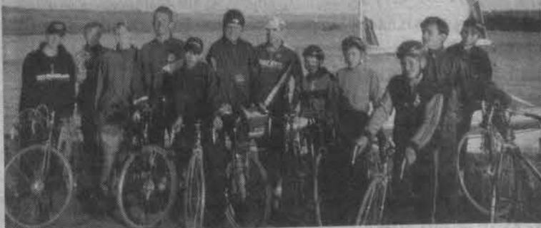
На старте велопробега. 1998 год.