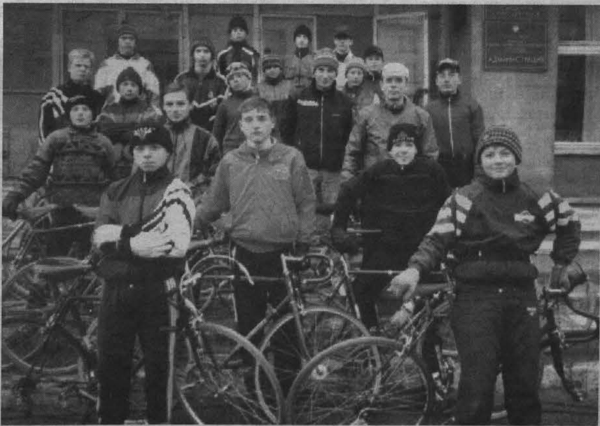
Перед дальней дорогой.

ему было каждый день рождения встречать в пути, быть и оставаться пилигримом.