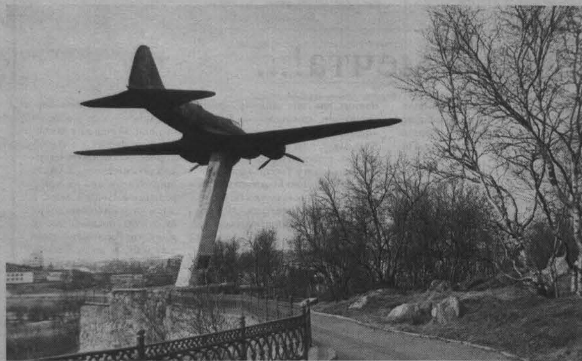
Памятник североморским летчикам, защищавшим в годы войны небо Заполярья.