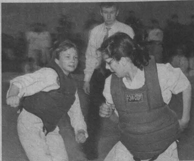
«Танцы» на татами.