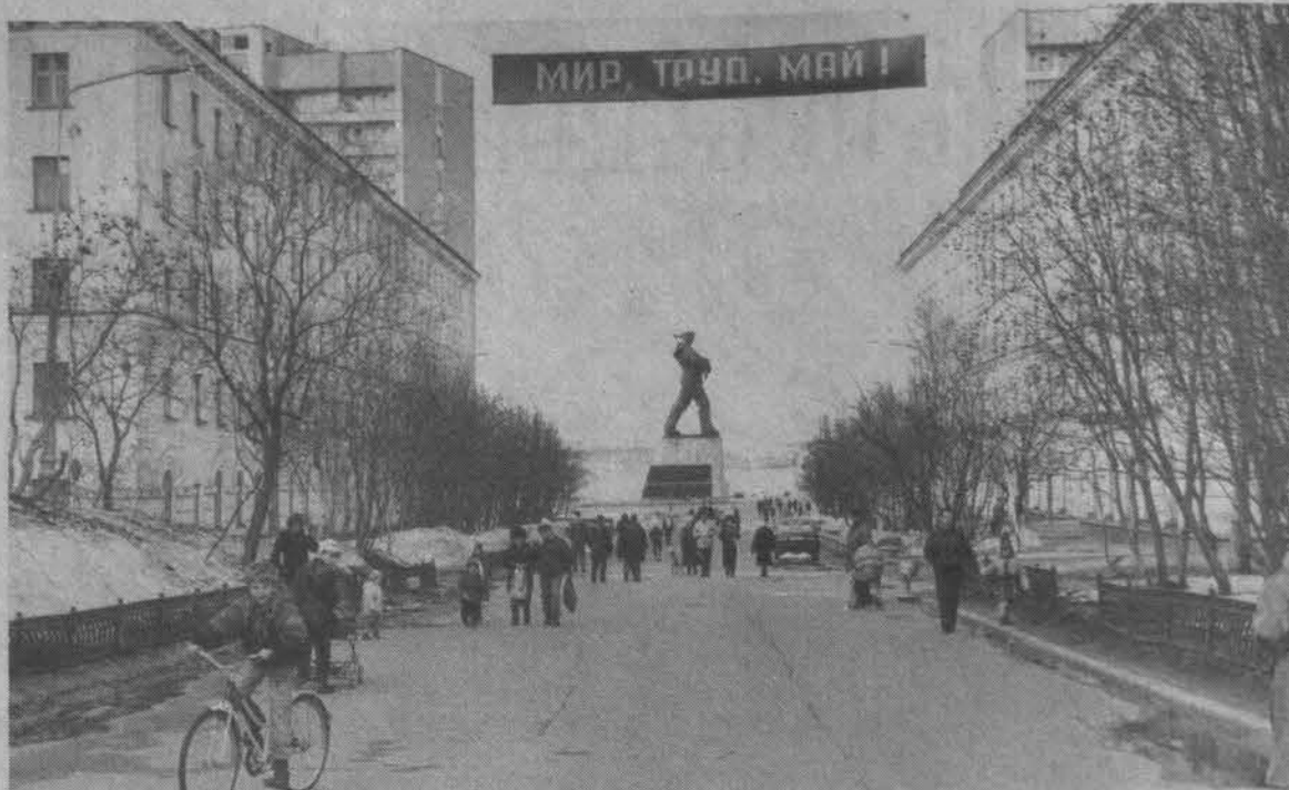
УЛИЦА САФОНОВА. Как бы хотелось, чтобы всем улицам нашего города уделялось столько же внимания...