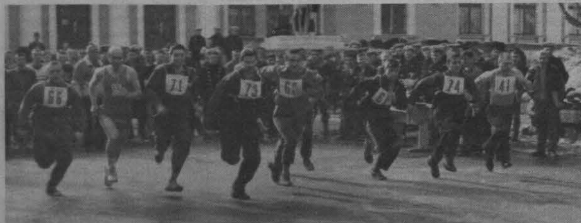
ЛЕГКОАТЛЕТЧЕСКАЯ ЭСТАФЕТА: дан старт первому этапу.

Начисление очков: 1 место - 16, второе - 15, третье - 14 и т.д.