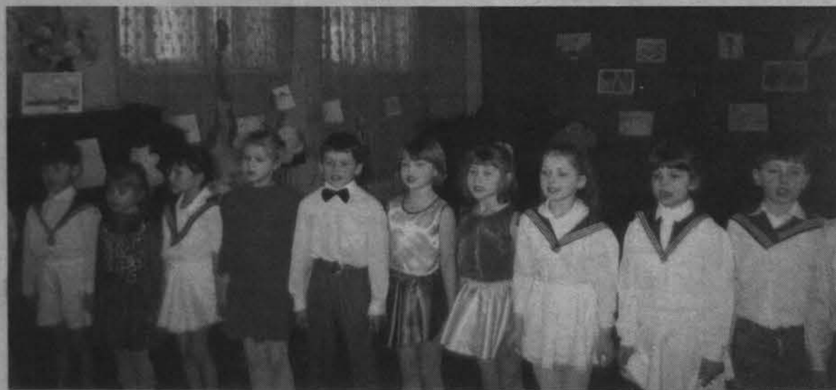
Ребята подготовительной группы «Сказка» исполняют песню «О родном городе».