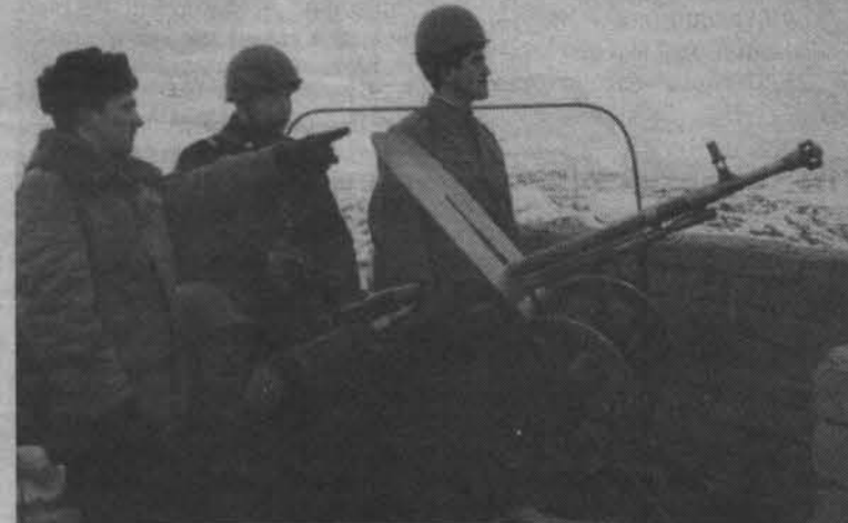
Расчёт ДШК готов к отражению воздушного удара противника.

Чтобы оценить действия отдаленных, разбросанных по северу Кольской земли подразделений и воочию убедиться в их способно-