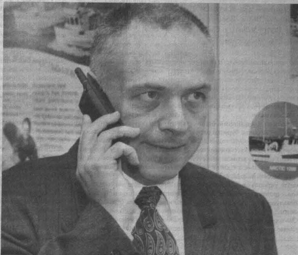
Даже в день своего рождения Андрей Козырев не забывает об избирателях.

- Нет. Ну, а что касается вашего города, то я себя в нем вдали от дома не чувствую, за что