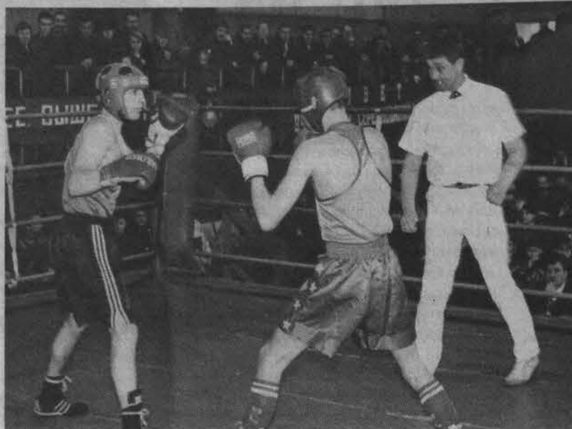
Финальный поединок. Через несколько минут будет известно имя победителя.