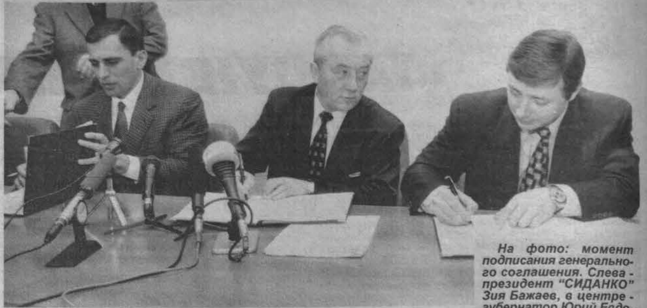
На фото: момент подписания генерального соглашения. Слева - президент "СИДАНКО" Зия Бажаев, в центре - губернатор Юрий Евдокимов, справа - генеральный директор РАО "Норильский никель" Александр Хлопонин.