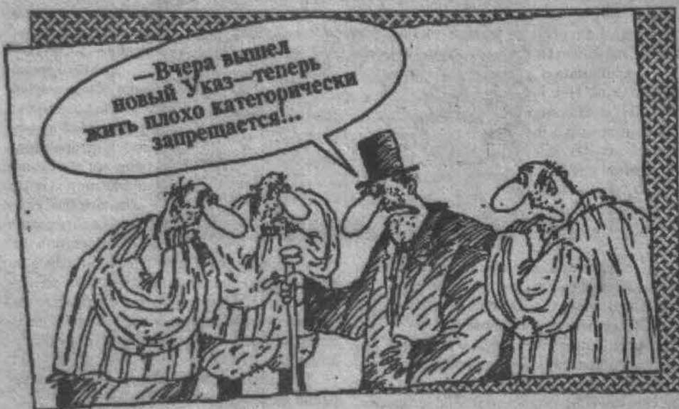
Рис. Вячеслава ШИЛОВА (С.-Пб.).

этаже - зал со стиральными машинами и сушилками, рядом или на крыше - бассейн и теннисные корты. Все это включается в общую сумму ренты, и дополнительная плата за это не взимается.