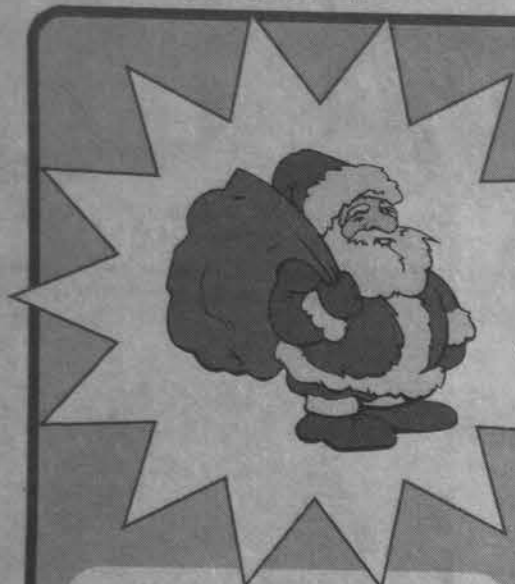
Аня Бричко, ученица 7 «В» класса СШ № 11