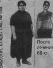
До лечения 124 кг. После лечения 68 кг. Лиц. № 0334503101, БЛАДС СМС № 989.

...уныло смотреть в зеркало и лицезреть свое бесформенное отражение. Выглядеть старше своего возраста, и постепенно накапливать разные болезни, связанные с ожирением; ... травить свой организм никотином, просыпаться по утрам от надсадного кашля и рисковать докуриться до рака легких или другой болезни; ...мучиться от похмелья после очередного перебора спиртного, давать себе зарок не пить, больше и больше разрушать головной мозг, печень.