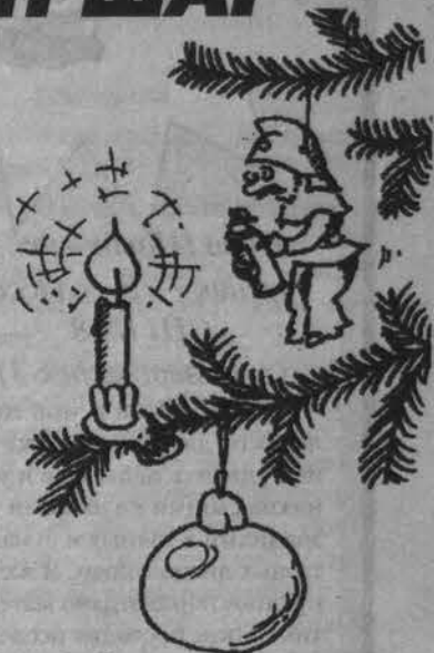
Рис. Василия АЛЕКСАНДРОВА.

вправе потребовать ее у продавца для ознакомления;