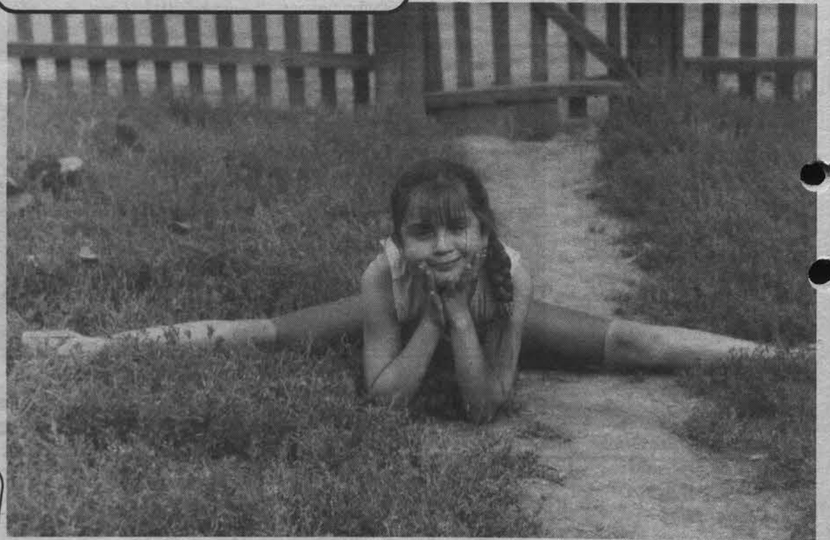
- А вам слабо?

Неужели кто-то еще сомневается в твоих блестящих способностях к математике? Раз так - удиви его! Ведь это проще простого! Пусть твой друг напишет в ряд три любые цифры - от 1 до 9. (Например, 6, 3 и 1). Ниже надо записать все двузначные числа, которые получаются из этих цифр. Таких чисел может быть только шесть. Потом твой друг должен сложить верхние цифры: 6+3+1=10 . Затем пусть сложит все двузначные числа: 13+31+16+61+36+63=220 . И, наконец, разделит вторую сумму на первую: 220:10=22 . На самом деле никаких расчетов делать не надо. Можно брать любые цифры, ответ все равно будет один и тот же - 22! А друг, наверно, очень удивится тому, что ответ ты знаешь заранее!