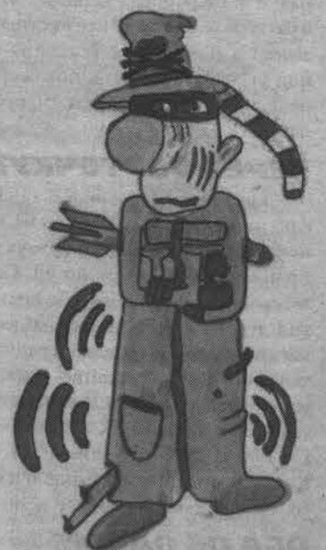
Рисовал Саша КАЧАЛОВ.