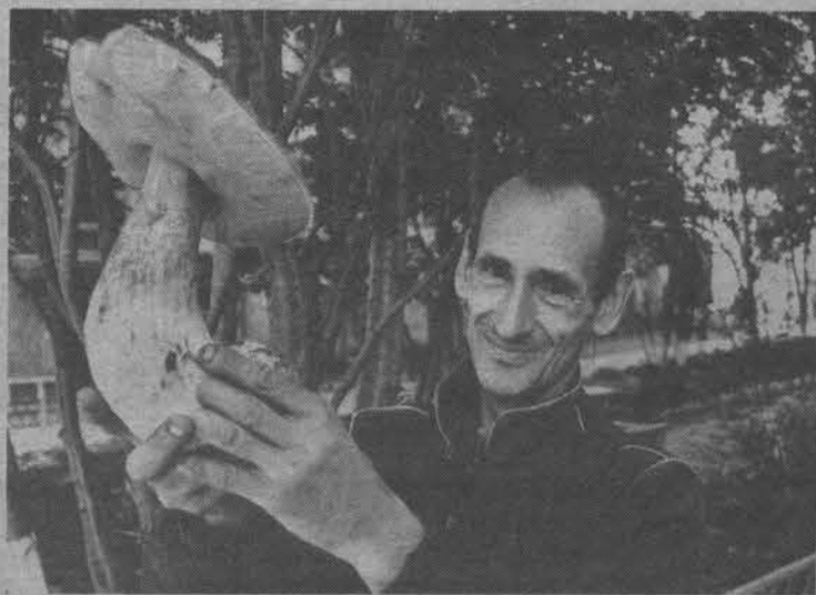
Вот такие грибочки растут этим летом!