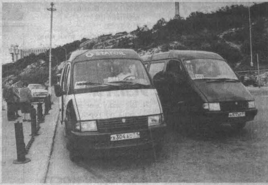
Поездка в Мурманск перестала быть проблемой.