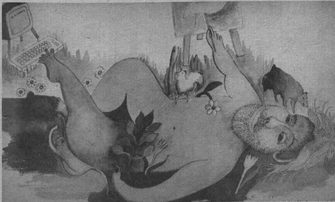
Полноценный человек («Автопортрет», бумага, акварельные краски, тушь).