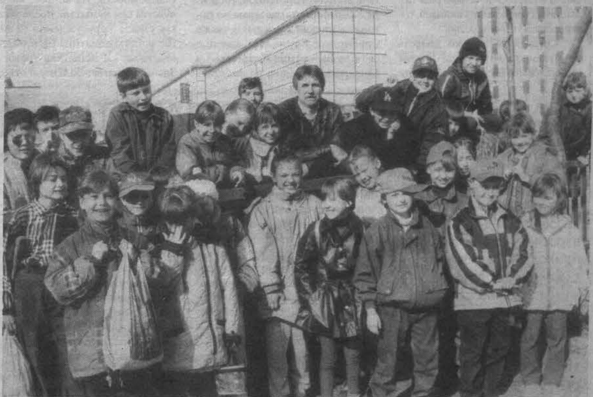
Каникулы - веселая пора.

Приходим в городской парк. Дети делятся на две группы: девочки берут скакалки и уходят в сторону от футбольного поля, а мальчишки организуют две команды, готовых сразиться друг с другом, несмотря на промозглую погоду. Причем эта разношерстная команда не уступает по боювости, как минимум, сборной России. Пока мы наблюдаем за играющими школьниками, их наставник рассказывает мне, что детскую площадку посещают, в основном, дети из малообеспеченных семей (в каждой школе ведется список). На одного ребенка выделено 40 рублей в день на питание (это завтрак и обед). Распределение средств строго конт-