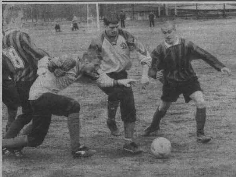
В футбол играют настоящие мужчины!