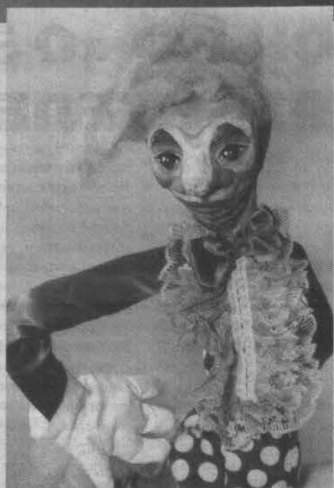
В сказке и в жизни.

Моей героине все-таки необычайно повезло. Судьба привела ее в художествен-