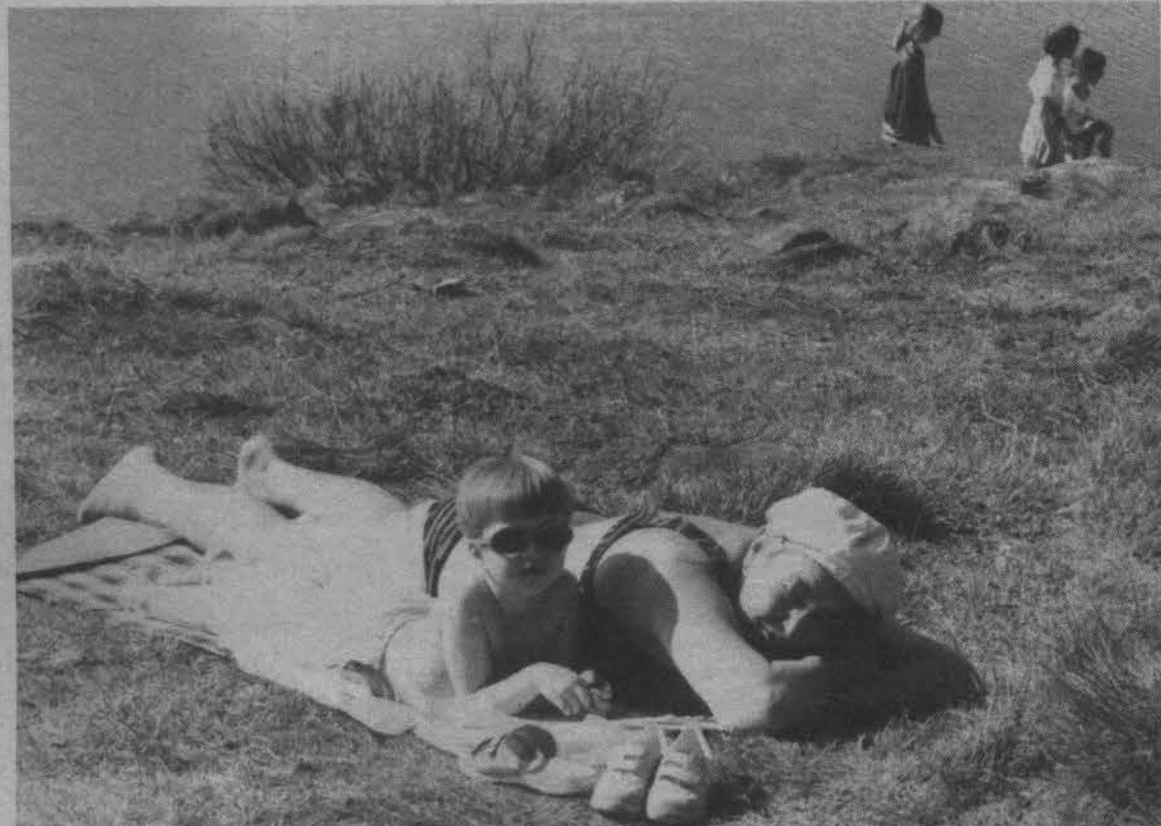
И на севере можно загорать.