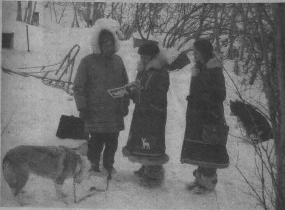
Свидетели Иеговы проповедуют повсюду.

ствия сеанса зариновой ароматерапии в токийском метро, изъятые впоследствии документы подтвердили, что военные планы командования «Аум Синрикё» включали в себя и мировое господство... Обезвредив две ловушки, сколько мы пропустили? И никто сегодня не может гарантировать, что ни один из нынешних «спасителей» не готовит новый план захвата власти.