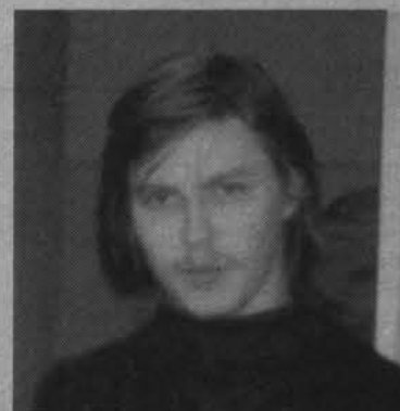
Самый крутой думер города.

При появлении вышеуказанных симптомов, больному необходимо как можно раньше обратиться в поликлинику, т.к. раннее выявление туберкулеза позволит своевременно начать необхо-